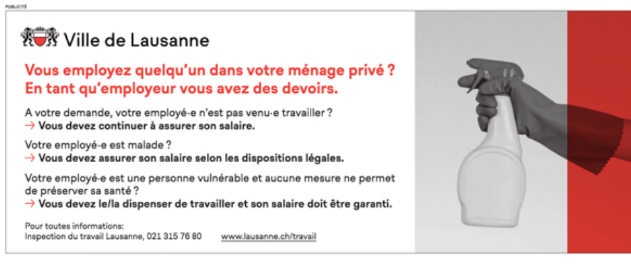
Figure 2 : Information de l'inspection du travail (ville de Lausanne) paru dans Le Courrier du 15 mai 2020.

Le Courrier , dont la rédaction est basée à Genève, a fait quant à lui paraître cet avis officiel de la Ville (voisine) de Lausanne, sachant que ce rappel à la loi valait aussi pour les résidents et citoyens genevois :