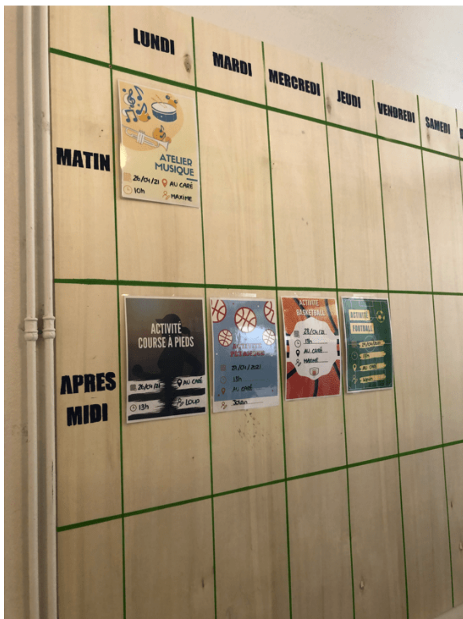
Figure 6 : (avril 2021).