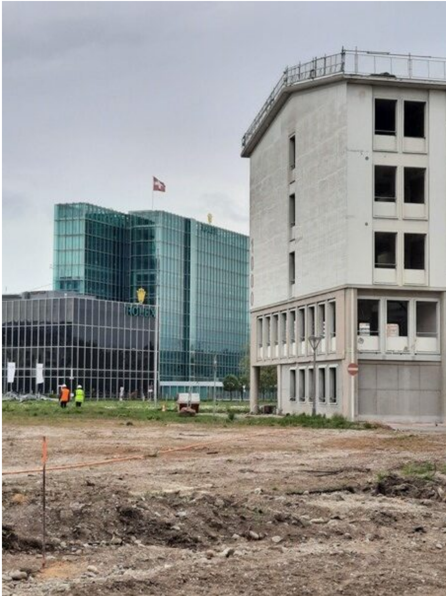
Figure 7 : Photo des auteurs, avril 2021.

À l'issue de cette évacuation, d'anciens pensionnaires ont encore pu goûter à un rare degré d'hospitalité. En effet, une « idée » du groupement associatif CAUSE a rencontré l'intérêt des autorités publiques, lesquelles se retrouvaient avec — selon les dires d'un membre de CAUSE — 400 « sans-abris » sur les bras, ou plutôt dans la rue. Un certain nombre de ces personnes ont été hébergées dans des chambres individuelles d'hôtels ou d'auberges de jeunesse, selon un principe « d'accueil 24/24 », comme le souhaitait CAUSE , qui entendait aussi se montrer « solidaire » avec les professions hôtelières et l'« industrie de l'hospitalité » genevoises, durement touchées par la crise pandémique. Comme nous le dira un des fondateurs du collectif CAUSE , heureux de la concrétisation de cette « idée », qui avait d'abord été repoussée par les autorités : « On bénéficie de cette parenthèse de la pandémie, avec un mot d'ordre : personne dans la rue ».