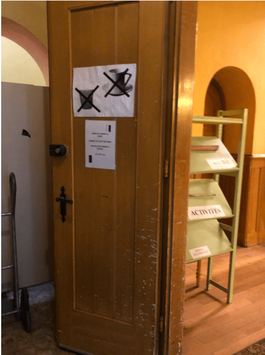
Figure 4 : Photo des auteurs (avril 2021).

Quant au CARÉ , qui propose d'ordinaire un « accueil libre, sans inscription, ouvert à toute personne adulte en situation de vulnérabilité », on y accédait, en aout 2020, en descendant quelques marches menant directement sur la salle en sous-sol, à la fois espace de rencontre et de repas. À l'instar de l' Espace Solidaire Pâquis , une nouvelle table (surplombée d'une tente à l'automne 2020) était aussi apparue au CARÉ , marquant le seuil du lieu d'accueil. Deux bénévoles y proposaient, outre du désinfectant pour les mains, du café à emporter : signalant du même coup qu'il n'était plus possible de s'attabler pour le déguster librement à l'intérieur. Un portail barrait aussi l'accès à l'escalier menant à la salle commune : une collaboratrice venait l'ouvrir de l'intérieur, sur demande des bénévoles stationnés à la réception nouvellement instituée. Le changement était d'importance, l'usager ne poussait plus spontanément la porte de l'extérieur, on la lui ouvrait de l'intérieur, seulement après qu'il s'est arrêté à un seuil, au-delà duquel il ne pouvait pas nécessairement s'aventurer. Les choses se présentaient donc ainsi en aout 2020.