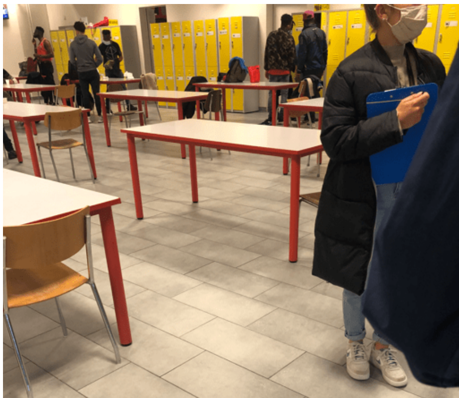
Figure 5 : Photo des auteurs (avril 2021).

Le jour de notre dernier passage, en comptant le personnel, le CARÉ rassemblait ainsi entre 20 et 25 personnes, dont un certain nombre massé auprès des « casiers ». La localisation préférentielle des usagers présents à proximité des « casiers » n'est pas anodine, elle tient à une nouvelle règle, instituée durant le premier semi-confinement et toujours en vigueur. En vertu de cette règle, l'entrée au CARÉ suppose une inscription préalable, notamment pour les douches, sauf pour qui y a un « casier ». Avoir un « casier » suspend non seulement la nécessité d'une inscription préalable pour entrer mais confère aussi à l'usager le droit de rester pendant une heure dans l'espace du CARÉ . Concrètement, le « casier » vaut donc comme un sésame : permettant d'abord de franchir le seuil, il donne ensuite droit à l'usufruit des lieux une heure durant, « voire plus s'il n'y a pas trop de monde » — bien entendu, la demande de « casier » a fortement augmenté ces derniers temps, puisque s'en voir octroyer un autorise à reconstituer la configuration de l'accueil « à bas seuil » : « si j'ai un casier, je peux rentrer », voilà le calcul que feraient (à raison) les usagers selon notre interlocutrice.