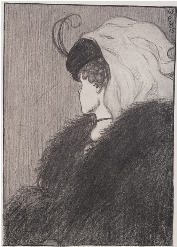
William Ely Hill, « My Wife and My Mother-in-Law », 1915.

Le dessin « My Wife and My Mother-in-Law » [1] est une illusion visuelle créée par l'artiste britannique William Ely Hill en 1915. Ce dessin est souvent associé au psychologue américain Edwin Boring (1930) qui l'a utilisé dans ses travaux sur les biais de perception et lui a donné le nom de « The Young Girl and the Old Woman ». Dans ce dessin, deux images se superposent : une jeune femme élégante vue de trois-quarts arrière et une femme âgée de profil avec un menton proéminent. Bien que principalement utilisé dans le domaine de la psychologie, ce dessin offre des analogies intéressantes pour les praticiens de l'aménagement des territoires.