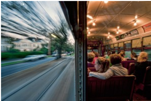
Photo 1 : Le tramway de La Nouvelle-Orléans (Louisiane/États-Unis)

Traversée de quartier sur l'avenue St Charles..