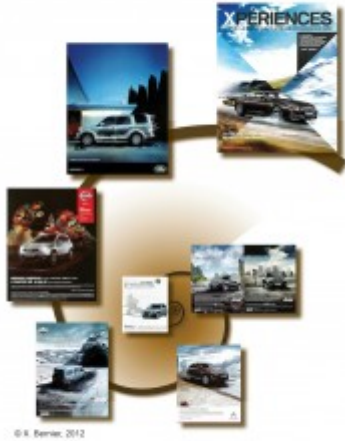
Figure 3 : Du tous espaces au tout-espace : un agencement hélicoïdal des images associées aux 4X4 dans la publicité envisagé comme gradient d'intensité du traverser.

La publicité pour BMW est sans doute celle qui exprime le mieux les dimensions du traverser et celle qui illustre de la façon la plus forte la cristallisation du traverser dans l'image. Son titre suggère une succession d'« expériences » tandis que les quatre facettes de l'image disent les quatre saisons (tous les rythmes), mais aussi tous les espaces. Le véhicule tout terrain est celui du tout espace en quelque sorte. L'image condense ici toutes les traversées en ce qu'elle dit le traverser. D'un point de vue sémiotique et symbolique, le signe X des 4X4 (« Xdrive ») est le point de convergence d'une mise en tension spatiale qui se fait à partir de l'individu social ou du groupe social. L'éclatement puis la recomposition des unités d'espace en morphologies spatio-temporelles sont aussi des arrangements dans la sémiosphère. Ils participent pleinement de la mise en relation qu'est le traverser. La langue et les mots utilisés pour désigner certains véhicules sont édifiants, avec, par exemple, la figure à succès du Crossover .