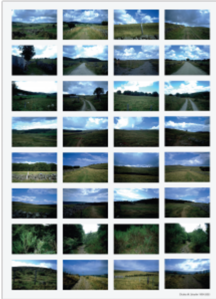
Figure 2 : Extrait des photographies utilisées pour l'étude. L'Aubrac : un paysage homogène aux variations multiples.

L'Aubrac est un plateau elliptique de 55 kilomètres de long sur 40 kilomètres de large légèrement ondulé et incliné vers le nord-ouest. Il se situe à une altitude moyenne de 1300 mètres et son point culminant s'élève à 1471 mètres. Le plateau est délimité à l'ouest, au nord et à l'est par une rivière appelée la Truyère et au sud par le Lot. Le plateau s'insère dans un système de moyennes montagnes avec, au nord (35 kilomètres), le Plomb du Cantal et à l'est, les monts de la Margeride.