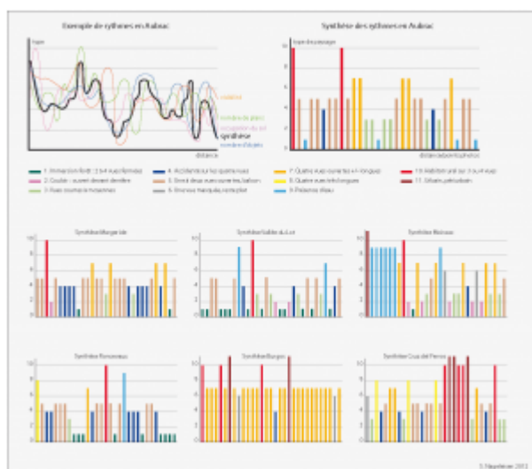
Figure 5 : Exemples de comparaisons des rythmes paysagers.

Au cours de sa traversée de l'Aubrac, le randonneur/pèlerin peut voir six des onze types paysagers identifiés sur l'ensemble de Saint-Jacques[25]. De nombreux autres secteurs comportant le même nombre de kilomètres en enregistrent davantage. Les alentours de Moissac (région Midi-Pyrénées) permettent, par exemple, de voir dix types paysagers. L'Aubrac serait presque au même rang que Burgos (Castille-et-Leon), qui n'en présente que cinq. Pourtant, l'Aubrac est beaucoup plus apprécié ; il semble donc que la diversité paysagère ne soit pas le critère prépondérant et qu'il faut observer l'agencement de ces types paysagers. L'observation du graphique concernant l'Aubrac permet de voir la variété des scènes paysagères au cours du déplacement.