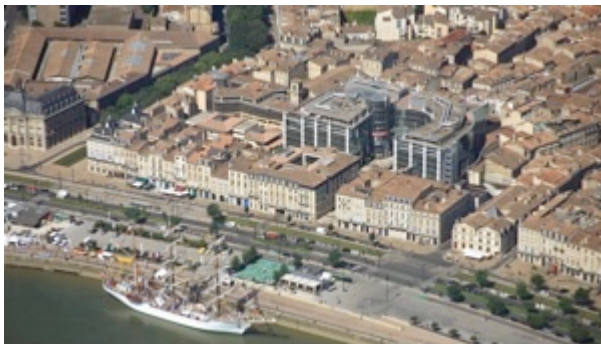
Image 2 : La Cité mondiale du vin, quai des Chartrons, accueille le commissariat de la série Section de recherches de TF1. Capture d'écran effectuée en janvier 2012.

généralement dans des milieux aisés. L'espace périurbain est largement exploité par deux séries populaires Famille d'accueil et Section de recherches . Dans Section de recherches , les scénaristes jouent avec Bordeaux, en font un « personnage » de leur narration, utilisant tour à tour tous les aspects sociaux et spatiaux de l'agglomération et de son environnement régional (Image 2). Ainsi, l'action des épisodes se déroule aussi bien dans les quartiers pavillonnaires aisés, que sur le bassin d'Arcachon, dans les vignobles périurbains ou dans les quartiers de grands ensembles. Le parti pris du réalisateur consiste à faire des plans aériens afin de situer l'action. Cette série propose ainsi une lecture multiscale de l'espace : la variété des espaces permet de représenter de véritables transects du territoire urbain bordelais.