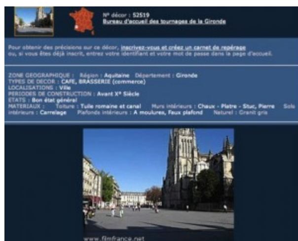
Image 1 : capture d'écran du site « Film France », effectuée en avril 2012.

Ainsi, le cinéma participe à la création du paysage par la confrontation de deux regards paysagers , pour reprendre l'expression de Jean-Louis Tissier. Il y a tout d'abord le regard « cinématographique » du cinéaste (plutôt que la vision), car le regard renvoie au sujet, à la subjectivité d'une personne singulière, à sa culture, son érudition, ses pôles d'intérêt, ses connaissances, ses compétences, ses savoirs, sa sensibilité. Le second est le regard du spectateur qui perçoit l'œuvre et se l'approprie. Y aura-t-il entre ses deux regards divergence ? L'action se déroulera dans un décor lisse, un décor que l'on peut alors qualifier de « non paysager ». Ces regards se compléteront-ils ou seront-ils parfaitement concordants, donnant alors un supplément d'âme paysagère à l'œuvre filmée ? Dans ces deux cas, le décor donc devient acteur. Le pays, devenu par l'action de la caméra une série de paysages-décors, nourrit alors la réflexion du géographe qui peut alors proposer sa lecture des territoires filmés.