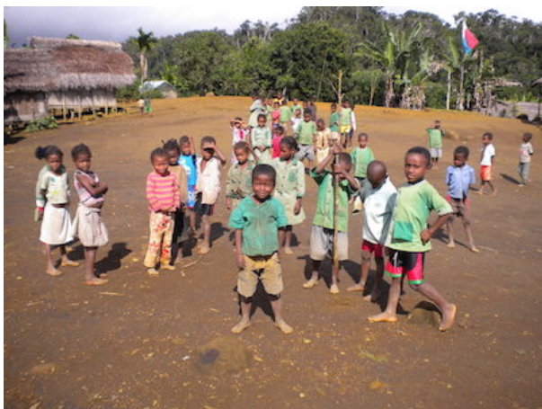
Figure 6 : ...et attendre dans l'enceinte de l'école plutôt que traîner en route.

cohésion : se rendre à l'école en groupe...