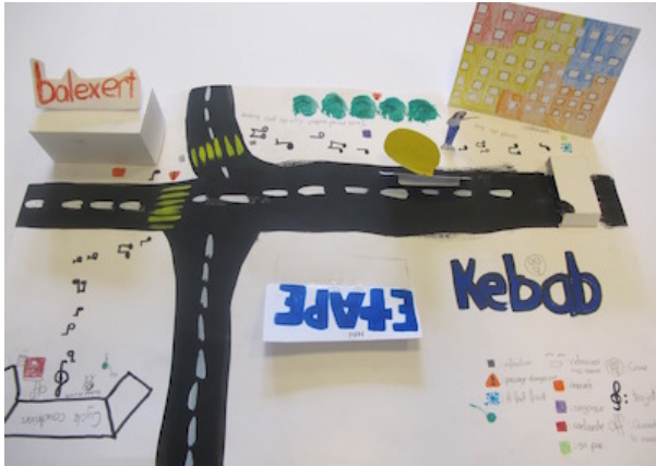
Figure 3 : « De chez moi à l'école », carte subjective du trajet matinal (représenté par les notes de musique) faite par Maylin (Genève, 2014). Habitant à 10 minutes de l'école, la musique de ses écouteurs rythme son trajet, de son immeuble jusqu'à l'entrée de l'établissement où elle est contente de retrouver ses copines.

explique : « Il y a les horaires aussi ! À une heure, il y a que les intellos perdus. À une heure et quart, c'est pour ceux qui n'ont pas fait leurs devoirs et à treize heures vingt-cinq ou vingt-six, le troupeau débarque ! Ceux qui arrivent pile ils en ont rien à foutre de l'école. Ils ont la réunion à treize heures trente pour fumer à [nom d'un centre commercial faisant face à l'école]. Je préfère à vingt-cinq trente, quand ils sont tous en train de monter c'est plus discret. »