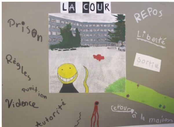
Figure 2 : « La cour », un espace ambivalent.