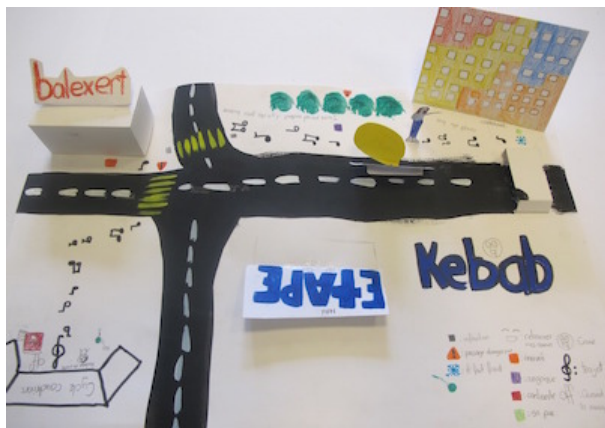
Figure 3 : « De chez moi à l'école », carte subjective du trajet matinal (représenté par les notes de musique) faite par Maylin (Genève, 2014). Habitant à 10 minutes de l'école, la musique de ses écouteurs rythme son trajet, de son immeuble jusqu'à l'entrée de l'établissement où elle est contente de retrouver ses copines.

explique : « Il y a les horaires aussi ! À une heure, il y a que les intellos perdus. À une heure et quart, c'est pour ceux qui n'ont pas fait leurs devoirs et à treize heures vingt-cinq ou vingt-six, le troupeau débarque ! Ceux qui arrivent pile ils en ont rien à foutre de l'école. Ils ont la réunion à treize heures trente pour fumer à [nom d'un centre commercial faisant face à l'école]. Je préfère à vingt-cinq trente, quand ils sont tous en train de monter c'est plus discret. »