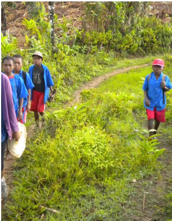
Figure 5 : Un double gage de sécurité et de

Il importe ici de nuancer en situant ces tactiques dans le temps individuel du parcours scolaire où la classe d'âge et le genre jouent un rôle primordial. À Genève, entre la première et la dernière année (9 e et 11 e ), l'heure d'arrivée tend à être de plus en plus tardive : alors que les premières années disent arriver une demi-heure en avance, les dernières années se contentent d'un quart d'heure ou de l'heure exact de la sonnerie. Les activités dédiées à ce temps de transition se modifient aussi. Alors qu'elles participaient de la préparation au rôle d'élève (faire ses devoirs pour les retardataires, se préparer à monter en classe), elles favorisent un temps consacré à l'entre-soi, notamment à travers les discussions entre pairs. Celles-ci étant une activité qui prend de plus en plus d'importance, en particulier chez les groupes de filles, ces dernières continuent de venir en avance tandis que ce sont les garçons de dernière année qui rejoignent le plus tardivement l'établissement.