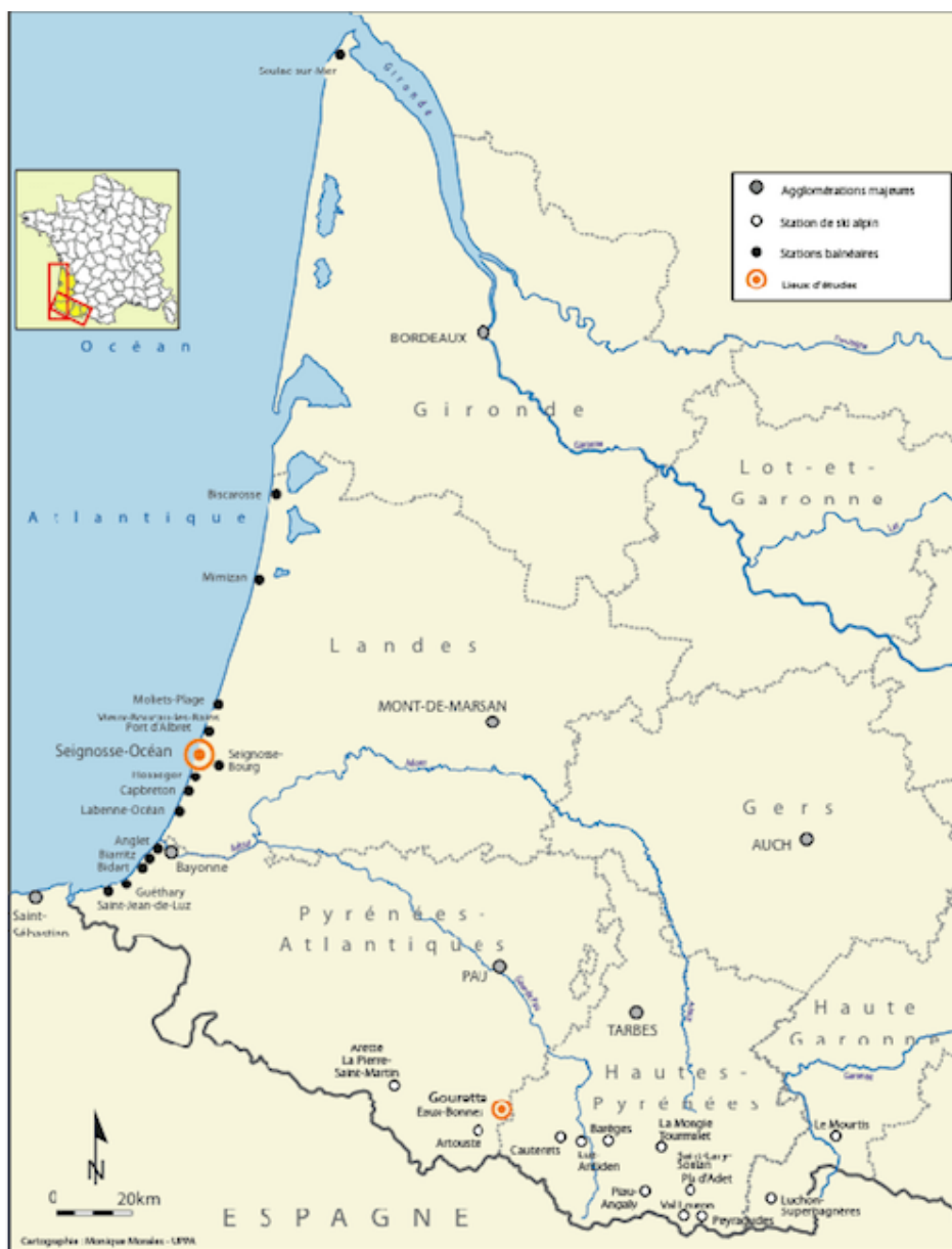
Les principales stations littorales et de montagne du Sud-ouest français (Cartographie : Monique Morales, Uppa).

Dans la lignée des approches en sciences sociales, marquées depuis les années 1990 par le « retour au sujet », l'intérêt se porte ici sur le regard du touriste qui « demeure un personnage méconnu, ou, plus exactement, ignoré » (Urbain, 1993, p. 47). Le postulat central qui sous-tend une attention nouvelle à cet habitant particulier consiste à interroger son approche sensible de l'espace touristique, entendu comme le territoire qu'il fréquente. Développe-t-il une conscience critique (latente ou réfléchie) des espaces publics et du domaine urbain qu'il fréquente ? Observe-t-il, juge-t-il, compare-t-il, apprécie-t-il ou rejette-t-il les formes urbaines qui s'offrent à son regard, à ses pratiques ? Comment peut-on appréhender ses représentations microterritoriales ? Nous souhaitons nous pencher sur les représentations « collectives » des stations étudiées à travers leurs espaces libres et accessibles à tous (donc non préfigurés pour une catégorie de destinataires en particulier). Au-delà de la diversité et des spécificités des représentations (représentations individuelles variables selon le genre, les générations, les trajectoires, les catégories sociales, etc.), il s'agit donc de cerner leurs fondements communs, « l'habitus qui les rassemble » (identification des représentations collectives, Briffaud 1994, p. 18). L'analyse part du principe que chaque