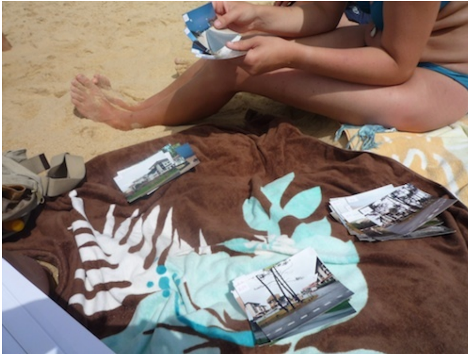
L'enquête en action : classement photographique à Seignosse-Océan (Hatt, 2009).

À Gourette, les enquêtes ont été principalement menées en front de neige, sur la place Sarrière et sur l'Esplanade du Valentin. Les enquêtés ont là aussi été choisis au hasard, en veillant à approcher des individus aux profils variés. Rencontrées dans l'espace public, les personnes qui acceptaient de participer étaient conviées à effectuer l'enquête dans un bar afin de disposer d'un espace (chauffé) pour élaborer le classement des photographies.