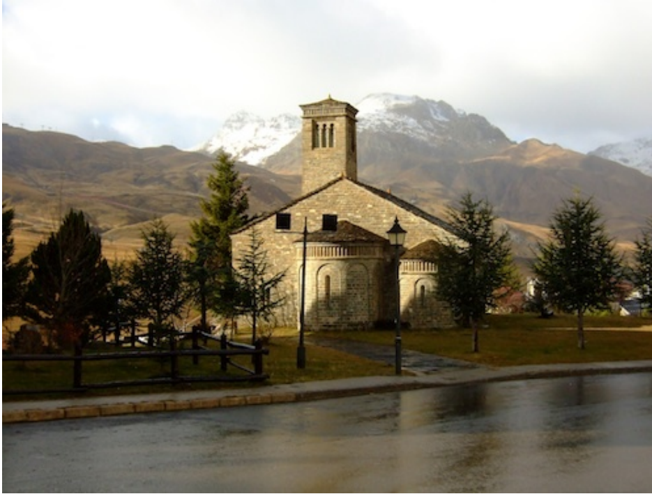
Image de Formigal non intégrée à la série des photographies de stations de montagne (Vlès, 2008).