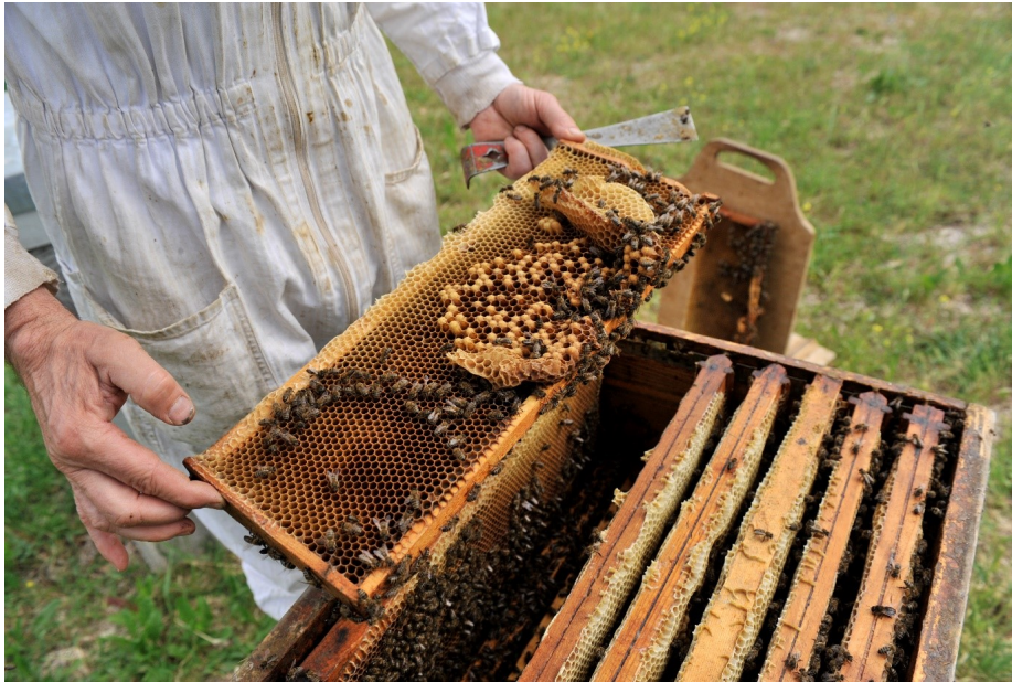
Ruche à cadres mobiles.