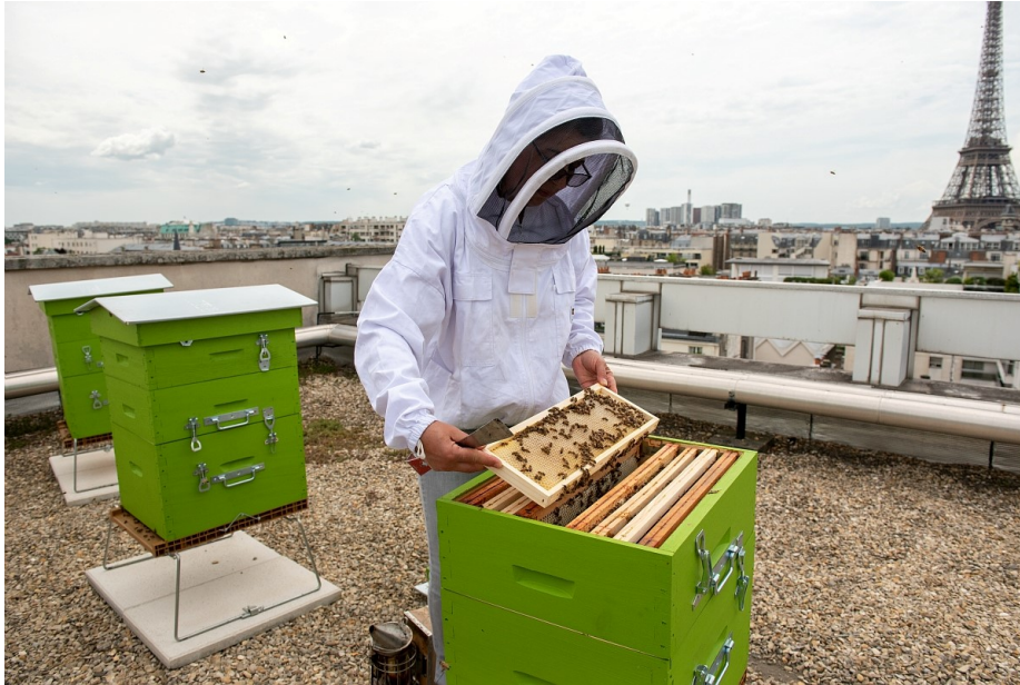
Apiculture urbaine sur le toit du siège Inrae à Paris.

enrôler le plus grand nombre de citoyens à la cause des abeilles. Le programme national « Abeille sentinelle de l'environnement » créé par l'UNAF en 2005, le label APICité fondé par ce même syndicat en 2016, la multiplication des ruchers municipaux et des fêtes consacrées à l'abeille ou encore les opérations de parrainage de ruches pour ne citer que ces exemples, constituent autant de vitrines politiques, de supports pédagogiques et médiatiques. De son côté, le ministère de l'Écologie, du Développement Durable et de l'Énergie met en place le Plan France terre de pollinisateurs (2016-2020) destiné à promouvoir les bonnes pratiques.