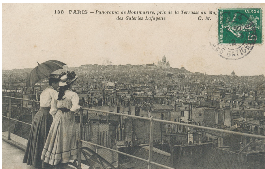
Figure 5 : Une carte postale datant de 1912, donnant à voir la terrasse des Galeries Lafayette Haussmann en tant que lieu agencé pour contempler les monuments consacrés de Paris - notamment le Sacré-Cœur ici.

autre élément intégré à ce type de médium (voir figures 5 et 6 ci-dessous).