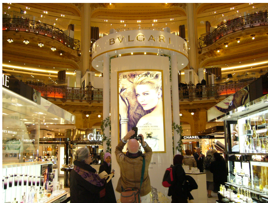
Figure 7 : Photographie à la verticale de la coupole depuis le hall. La monumentalité et l'art sont saisis par le prolongement de l'œil qui en permet la capture.

En effet, les pratiques touristiques ne peuvent se lire uniquement à travers la consommation de produits de luxe associés aux grandes marques (françaises notamment). Les Galeries Lafayette Haussmann font également l'objet d'un sightseeing , la découverte par le regard esthétique constituant une pratique très tôt mise en œuvre par les touristes (Urry 2002) depuis notamment l'émergence d'un goût pour la monumentalité (Équipe MIT 2011). La contemplation converge surtout vers la coupole (voir figure 7 ci-dessous), et alors que la photographie est mal venue ailleurs, elle est tolérée ici par les gestionnaires du site.