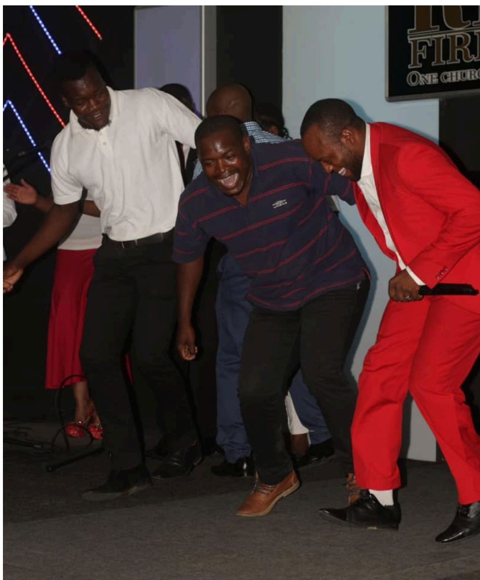
Photographie 5 : une scène de danse impromptue dans le hall qui