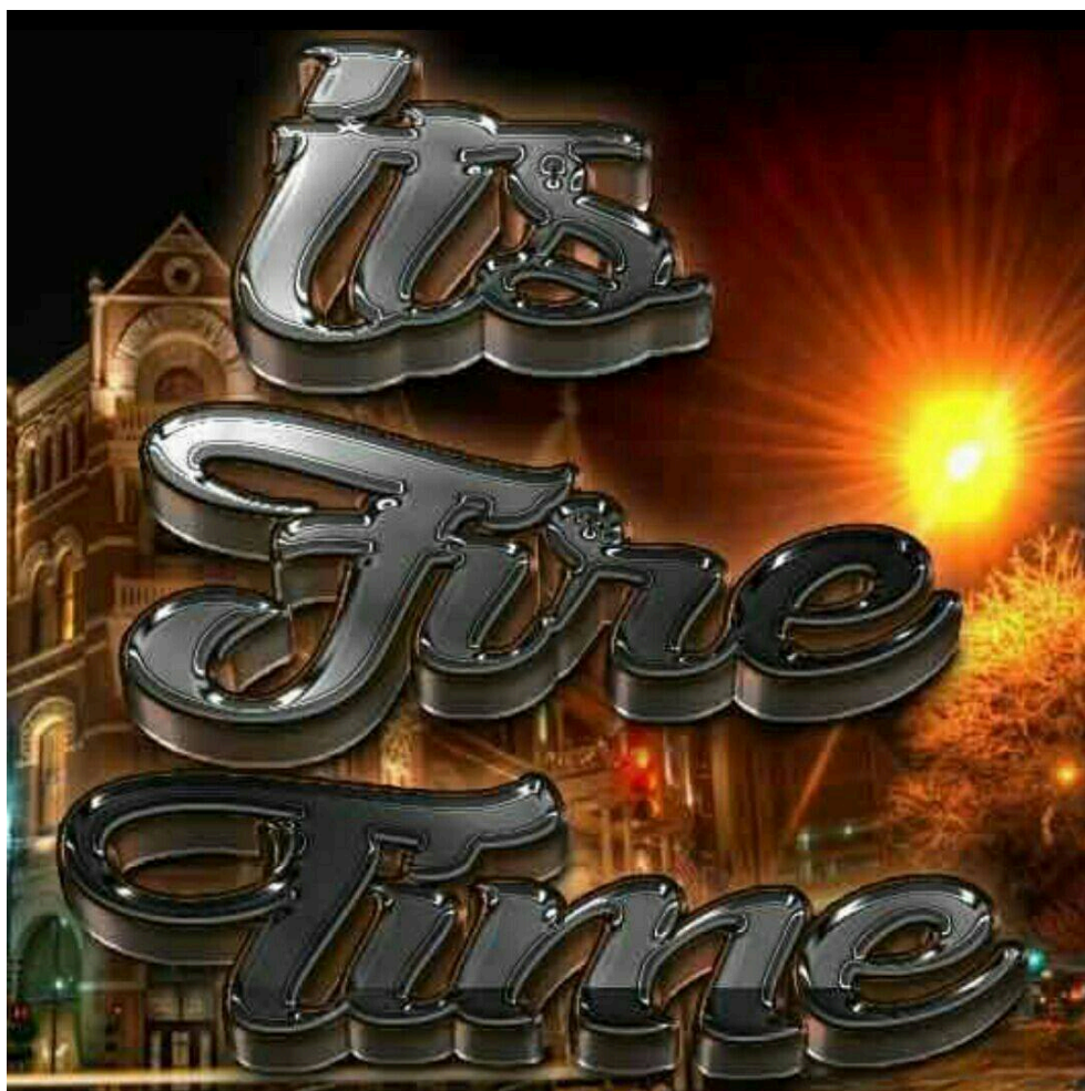
Photographie 3 : Logo de la Revival Ministries Church confectionné par le pasteur Russel

Celle-ci recouvre plusieurs ordres au sein desquels circulent ses fidèles si bien qu'ils s'auto-entretiennent. La première dimension de l'émancipation relève du domaine socio-économique puisqu'il vante la réussite matérielle dans une verve capitaliste. Autre mission qu'on peut qualifier de séculaire, celle de divertir ses fidèles en proposant, durant les cérémonies, ce qu'un de ses membres qualifia de « parenthèses enchantées ». Au demeurant si le pasteur fait prévaloir une logique individualiste dans la réalisation de l'existence de ses coreligionnaires, chacune d'entre elles se nourrit du reste de substantifiques échanges collectifs avec l'ensemble de la communauté qu'il préside et structure par des entrelacs festifs.