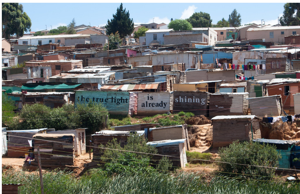
Photographie 1 : entrée du township de Kayamandi, Stellenbosch, Afrique du Sud.