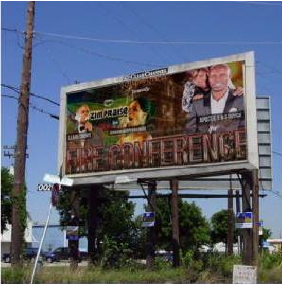
Photographie 9 : une affiche de la RFM dans la périphérie de Stellenbosch.