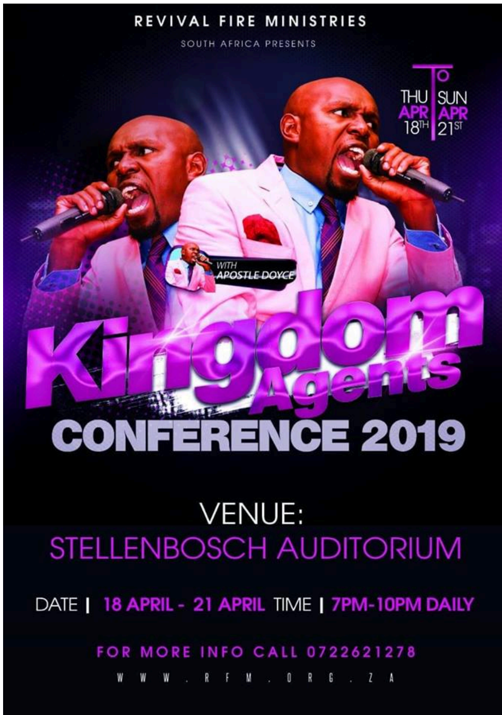
Photographie 13 : flyer de la RFM.

L'homme moderne, qualifié sans doute trop hâtivement et simplement par Mircea Eliade