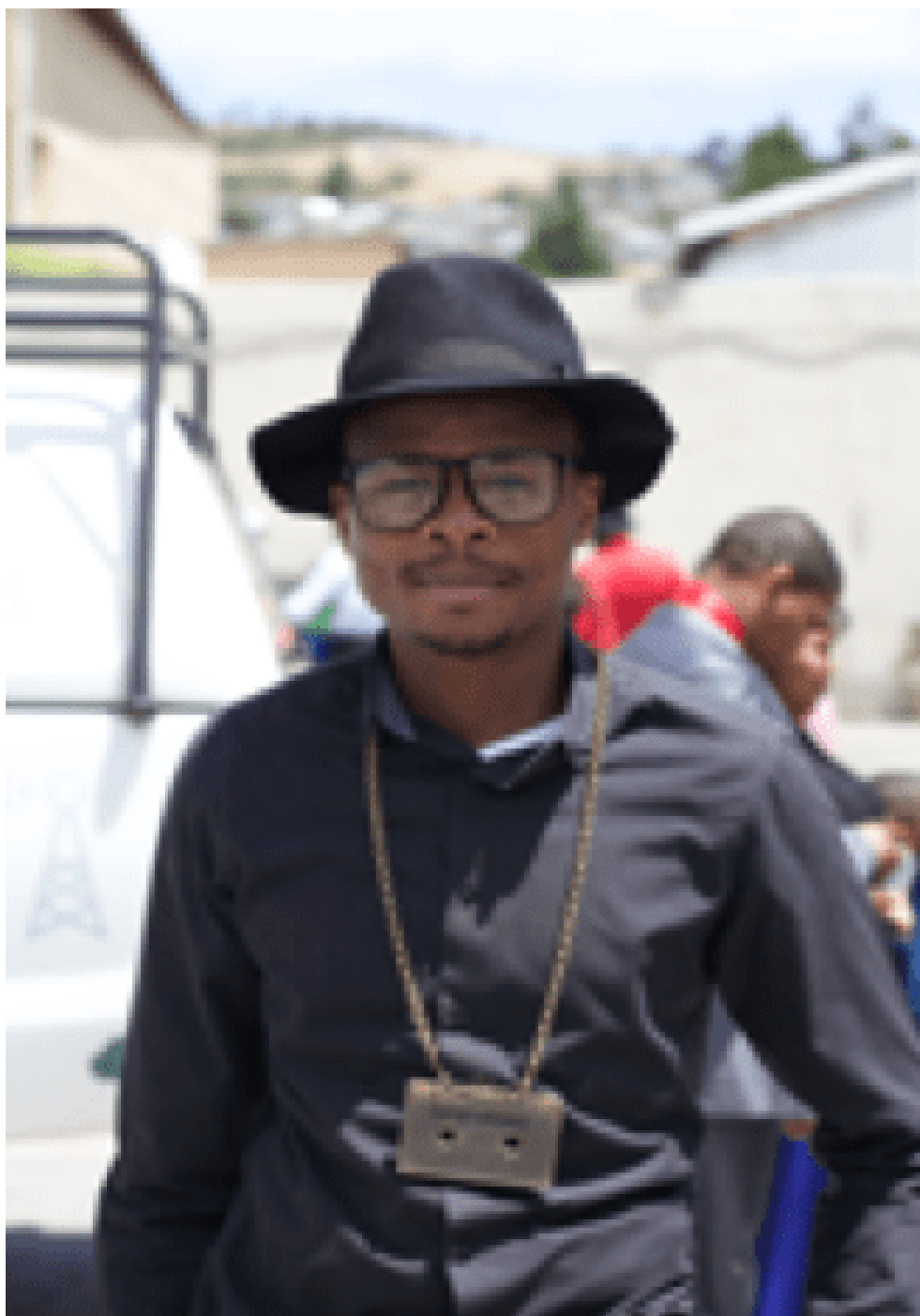
Photographies 10, 11 et 12 : podium de la Funny dressing competition.

À travers l'exemple du « pouvoir transformationnel du jeu », Erving Goffman développe sa