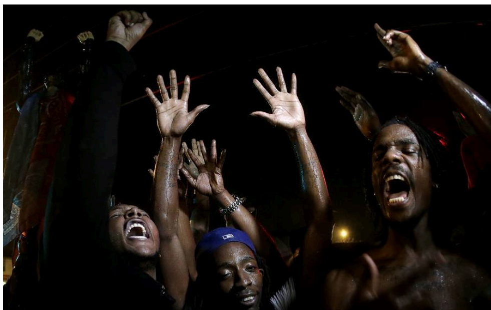
Photographie 17 : une scène de transe collective.

Ainsi cette lecture jungienne nous permet d'expliquer d'une part la dissipation de l'angoisse, fût-elle partielle. D'autre part perçoit-on dans l'association iconoclaste [1] du Christ au capitalisme la persistance du théologico-politique relevée par Marcel Gauchet (qui procède donc paradoxalement d'une sortie du religieux et de « l'éclipse du politique »).