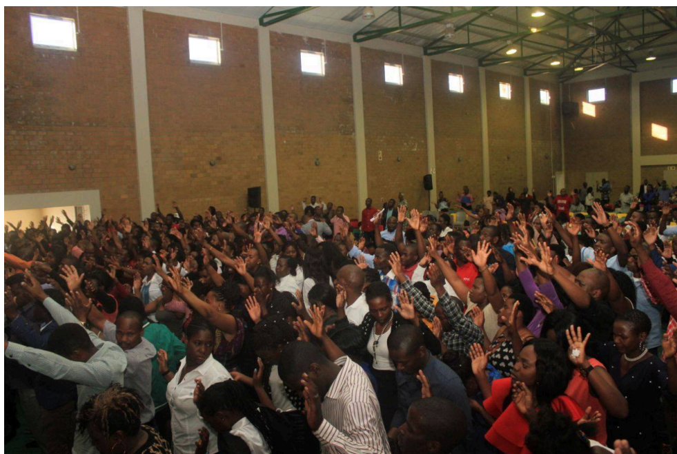
Photographie 7 : une assemblée en pleine extase collective, mais relevant pourtant d'un solipsisme.