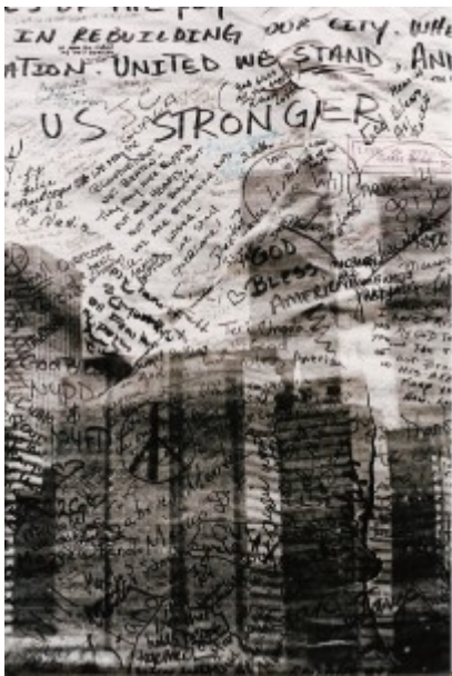
Illustration 7 : Grand panneau à écrire mis à la disposition des passants, New York (2001).

Il en va ici comme de nombreuses formes d'écriture collectives typiques, celle des pétitions, par exemple.