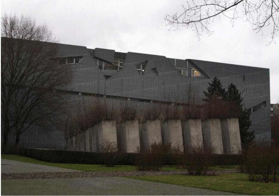
Image 2 : Le Jardin de l'Exil. Musée Juif de Berlin. Source : Dominique Chevalier, janvier 2011.

Le troisième axe mène à la tour de l'Holocauste. Les murs sont en béton brut, l'espace est vide, sans chauffage ni air conditionné, éclairé par une mince fente qui laisse passer un rai de lumière. Quiconque emprunte cet axe arbitraire entend la lourde porte se refermer sur son passage, une fois le seuil franchi. L'attente est pesante. Et la crainte qu'elle ne s'ouvre pas, réelle. Continuité, exil, destruction... Les trois axes se frôlent, et parfois se croisent, comme ils se sont entrecroisés dans la « vraie histoire ». Le temps est ici pensé en trajectoires qui se superposent et se côtoient.