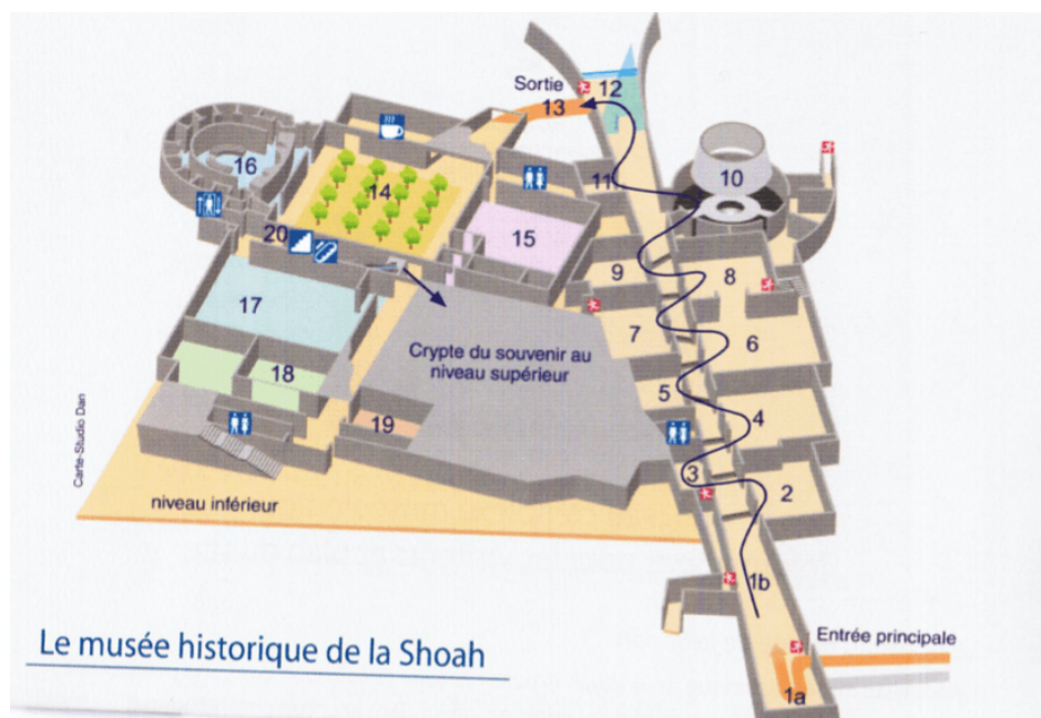
Image 3 : Plan du nouveau complexe muséologique de Yad Vashem.

L'itinéraire des déplacements est imposé[22] et, de manière métaphorique, le retour en arrière n'est pas prévu. L'espace conduit le récit par l'enchaînement de trajectoires imposées, à la fois au niveau du déplacement personnel, de l'agencement des objets, des archives et des témoignages, et du déroulement implacable de la barbarie nazie. Le monde juif d'avant-guerre est définitivement perdu et la béance démographique des six millions disparus, toujours pas comblée.