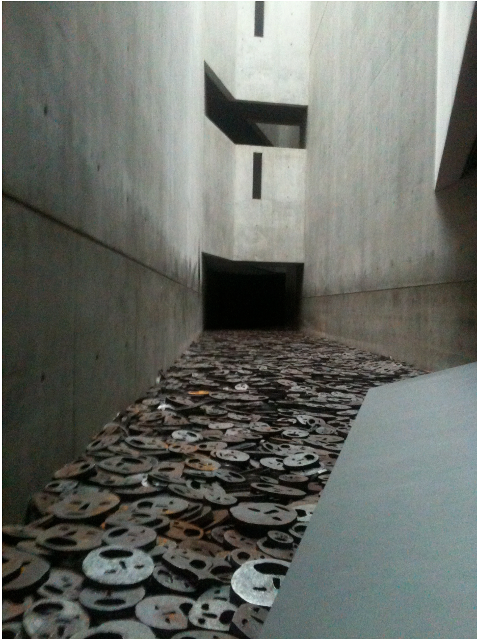
Image 4 : Installation de Menasche Kadischman dans « Le Vide de la Mémoire ».