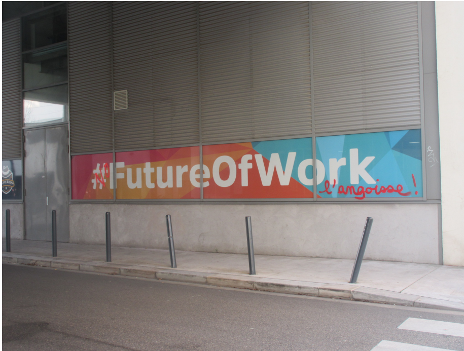
Figure 2. The future of work.