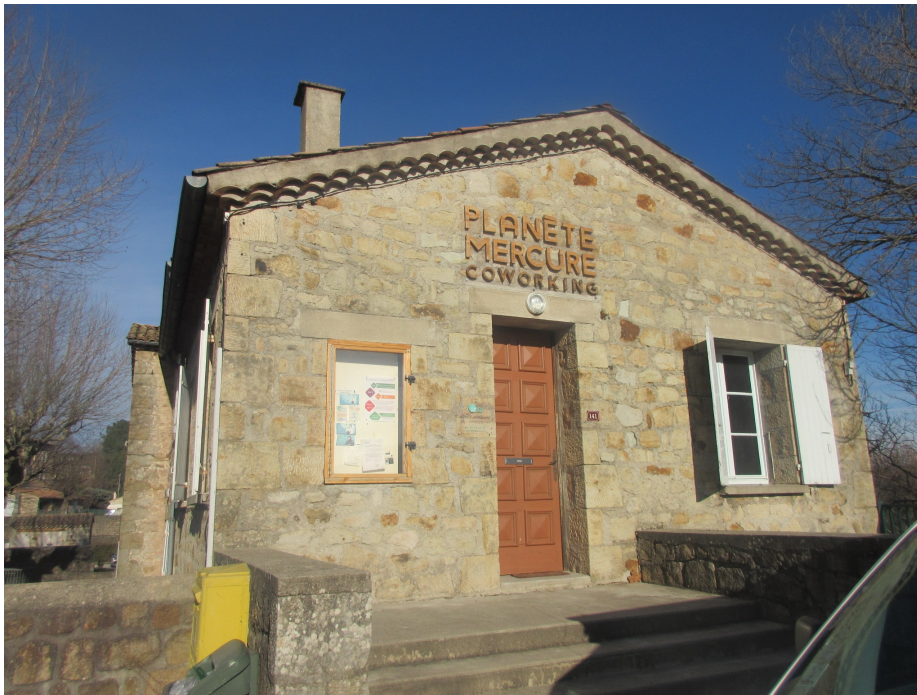
Figure 6. Un espace de coworking en Ardèche.

s'implantent ainsi de plus en plus souvent dans des espaces non exclusivement urbains et plus faiblement métropolisés (Leducq et al. 2019), plutôt sous le dénominateur générique de tiers-lieu, car ils sont souvent multifonctionnels (Besson 2018). Cela s'explique par l'adoption des nouvelles pratiques du développement territorial issues des grandes villes en milieu rural (Doyon et al. 2017), mais aussi par le développement du télétravail à grande distance (Ortar 2018, Sajous 2019).