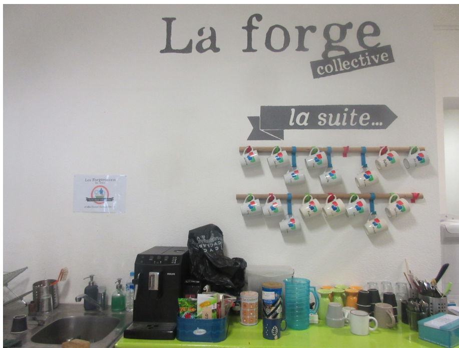
Figure 3. La cuisine d'un espace de coworking.

Les EC se distinguent d'autres modèles de bureaux partagés ou de pépinières d'entreprises par une volonté affichée de faire communauté (Liefoghe et al. 2013, de Peuter et al. 2017). En ce sens, les EC constituent la projection spatiale d'une communauté sociale. Ils sont conçus comme des lieux d'échange et de collaboration, de création de valeurs communes, de vie et d'animation (Scaillerez et Tremblay 2016, Waters-Lynch et al. 2016), des lieux qui sont à la fois de travail et de rencontre (Boboc et al. 2014).