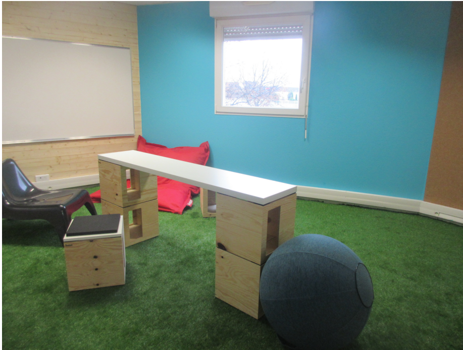
Figure 1. Une creative room dans un espace de coworking.

Tantôt défini comme « approche » dérivant de l'idée d'open-source (Lange 2011), comme « philosophie » issue du peer-to-peer (De Guzman et Tang 2011), « état d'esprit » (De Peuter et al. 2017) ou « mode de travail » (Uda 2013), l'objet coworking est alors distingué par l'originalité organisationnelle qui le caractérise par rapport à d'autres organisations productives. Composés de personnes n'ayant pas de relations hiérarchiques salariales entre elles, les EC reposent sur l'idée de sérendipité, de spontanéité et d'aléatoire supposés favoriser l'activité et l'innovation (Merkel 2015, Brown 2017).