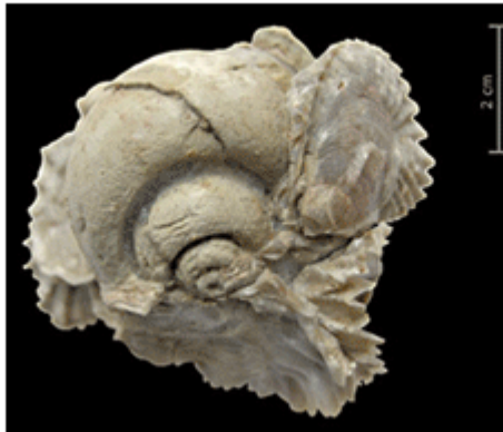
3a, 3b, 3c. Illustrations : oursin, huîtres, escargot ©OCC-SAP.

Environ 17 000 fossiles (poissons, tortues, crocodiles, coraux, mollusques, oursins, plantes, entre autres) ont été archivés dans les collections de la Paléontologie A16 (voir le site palaeojura.ch ). Intégrée à l'Office de la culture de la République et Canton du Jura, la Paléontologie A16 est basée à Porrentruy; sa mission consiste à prospecter, fouiller, prélever et documenter l'exceptionnel patrimoine paléontologique jurassien. La mise à jour de ces gisements a suscité un intérêt considérable dans la communauté scientifique internationale. De nombreux spécialistes de tous horizons sont venus à Porrentruy et dans le village voisin de Courtedoux pour observer et mesurer sur le terrain l'importance de ces découvertes. À la lecture des rapports des experts, ces fouilles recèlent un des plus riches patrimoines mondiaux en ce qui concerne le Jurassique supérieur (-161 à -145 millions d'années).