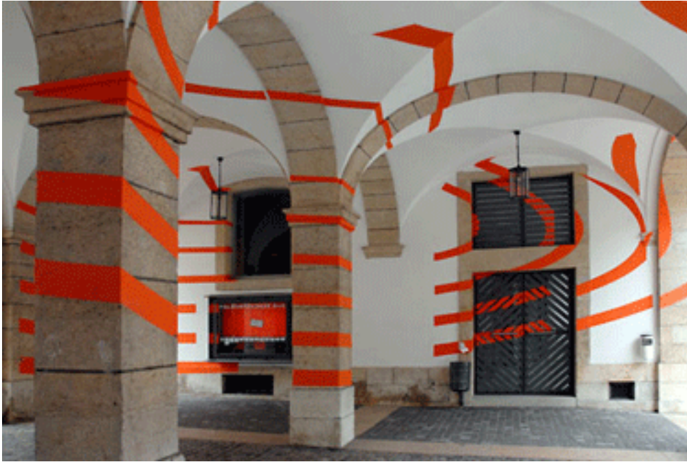
7. Illustration : F.