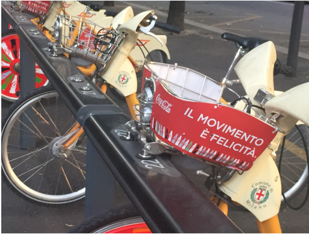
Image 3 : Le bonheur dans le mouvement : vélo, Milan, Coca Cola.

Ce serait aller un peu vite. Il faut plutôt profiter de l'événement pour constater un fait : la thématique de l'alimentation connecte les deux enveloppes naturelles de l'humanité, le corps et la Nature. Comme nous sommes progressivement devenus acteurs dans ces environnements, ce qui a longtemps été de l'ordre de la fatalité est devenu problème, celui de la tension entre liberté et responsabilité. À travers ces sujets, nous parlons autonomie individuelle, espace habité, et politique. Et peu importe au fond que ce soit à propos d'une tranche de pizza au coin de la rue ou d'un bar à vin chic : pour toute la partie de l'humanité qui mange à sa faim (et dont la proportion ne cesse d'augmenter), il y a quelque chose de commun, de devant-être-partagé dans le rapport à la nourriture, quelque chose qui lui parle d'elle-même, de ses problèmes, de la singularité de chacun de ses membres et de sa sociétalité commune, tendanciellement mondiale. Manger n'est pas seulement une activité banale, nécessaire et agréable, mais un enjeu universel. Comme souvent, la zone molle de la classe moyenne — celle qui est à la fois indolente et de bonne volonté — et les professionnels spécialisés qui, tels les concepteurs d'« événements », s'emploient à la comprendre pour mieux en tirer avantage, nous disent des choses fondamentales sur le monde tel qu'il va.