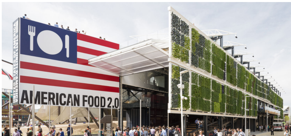
Image 2 : Le pavillon des États-Unis : cultiver (verticalement), manger (dans toutes les positions).

Derrière ce paradoxe, un mystère plus général : pourquoi aller dans la grande banlieue de Milan et payer entre 27 et 39 € (c'est le coût du billet d'entrée) le droit d'accès à des cafés-restaurants eux-mêmes très chers et proposant des menus stéréotypés, alors qu'on pourrait trouver plus sophistiqué et à des prix plus abordables en ville ? Ce mystère, la psychologie le percera sans doute un jour, quand elle sera enfin devenue une science sociale. C'est le mystère Las Vegas : pourquoi les hôtels-casinos qui imitent une ville (Paris, Rome, New York,...) semblent-ils disposer d'atouts qui échappent à l'originale ? Il existe aujourd'hui un nombre considérable de fausses Venise, notamment dans les parcs à thème « Monde » de Chine et dans les centres commerciaux du golfe Persique, dont le succès ne se dément pas. En arrière-plan de ce phénomène, il y a peut-être le syndrome Walt Disney . Pourquoi les enfants, jeunes ou vieux, préfèrent-ils des représentations très stylisées des personnages, animaux ou humains, à une image plus réaliste ? La complexité fatigante, elle apparaît d'abord comme compliquée et l'altérité rebute du fait même qu'elle présente des réalités à décoder, au moins un peu, avant usage.