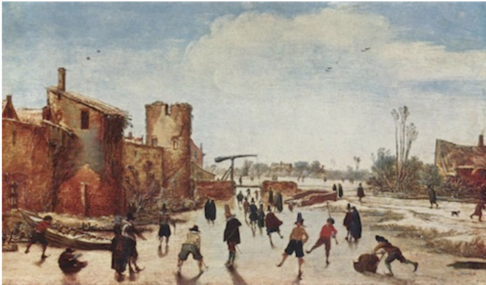
Ill.5 : : Esaias van de Velde, 1618. Munich, Alte Pinakothek.

Enfin, l'auteur évalue le degré de synchronicité existant entre des événements climatiques marquants dont nous avons connaissance sur la période et le contenu des productions artistiques qui les succèdent. De ce fait, certaines corrélations interpellent. Si Hendrick Avercamp peint sa première scène d'hiver juste après l'épisode glacial de 1608, Salomon Van Ruysdeal ne peint quant à lui pas d'hiver entre 1627 et 1640, période durant laquelle les observations témoignent d'un climat plus doux. Mais ces correspondances ne semblent toutefois pas statistiquement évidentes du fait qu'il existe d'autres hivers rigoureux sans que ceux-ci ne semblent pour autant avoir influencé de nombreux tableaux.