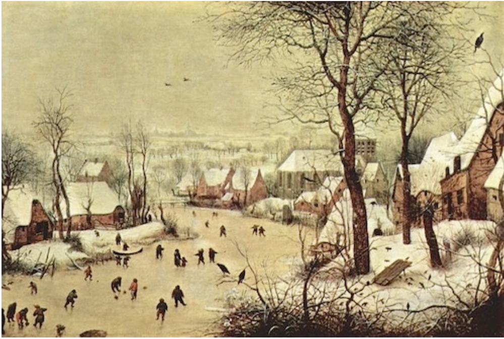
Ill.1 : Winterlandscape with skaters and bird trap, 1565. Coll. De Dr. F. Delporte.