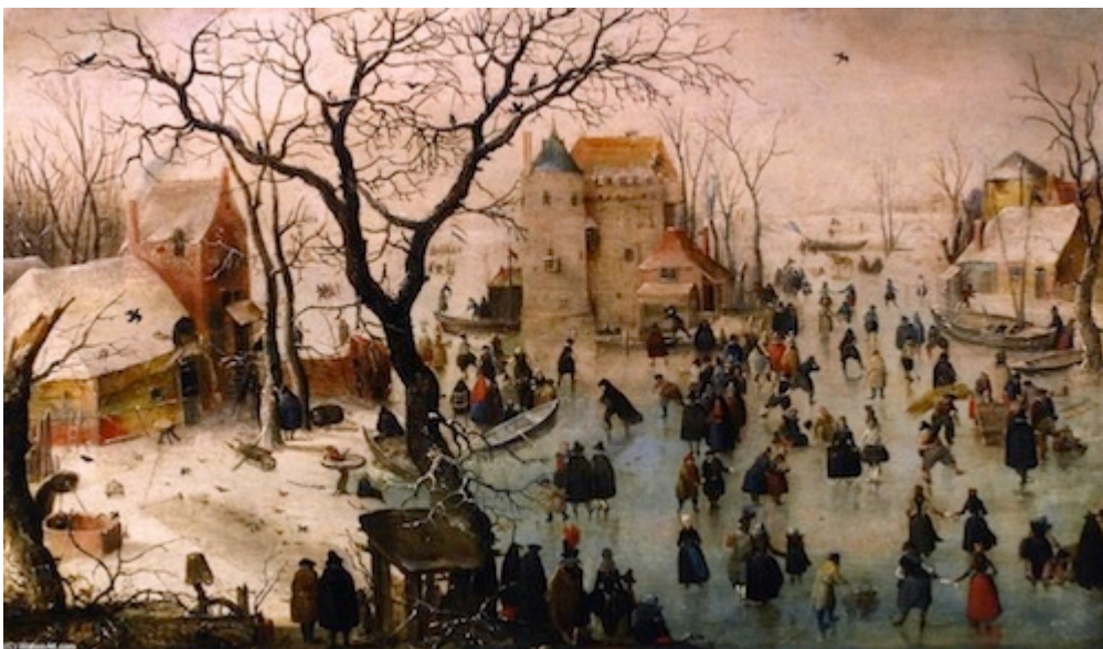
Ill. 2 : Paysage d'hiver avec un château, 1608. Bergen Kunst Museum.

Si face à cette coïncidence maintes fois relevée, l'hypothèse d'un « déterminisme climato pictural » semble faire consensus, Alexis Metzger relève que personne n'en a jamais fait une véritable démonstration et se propose donc de porter un regard plus attentif sur cette concordance de faits. Dans la première partie de son ouvrage, divisée en trois temps, il invite à évaluer les corrélations entre phénomènes climatiques observés et productions picturales. Il traite d'abord du contenu naturaliste des tableaux (figuration des éléments météorologiques), puis aborde les représentations sociales de l'hiver et finit par tenter de lier statistiquement le degré de rudesse des hivers avec les fluctuations observables dans le rythme des productions picturales. Dans un premier temps, Alexis Metzger confronte les observations météorologiques de l'époque (fidèlement faites par les météophiles contemporains des hivers en question et aujourd'hui archivées aux Pays-Bas) aux éléments picturaux choisis par les artistes pour représenter l'hiver. Un constat s'impose alors : les