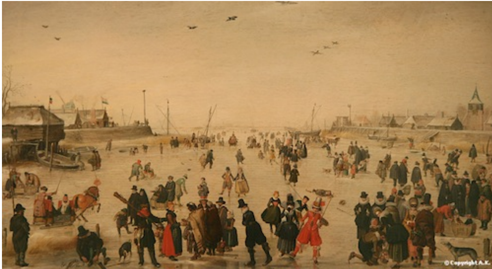
Ill. 3 : Scène d'hiver sur un canal gelé, vers 1620. Los Angeles County Museum of Art.

conditions météorologiques représentées sont quasiment tout le temps les mêmes (glace et fin manteau neigeux) alors que plusieurs hivers témoignent de situations différentes (pas d'englacement, ni de chutes de neige abondantes). Pour exemple, Hendrick Avercamp, qui vivait au bord de la Zuiderzee, a toujours représenté cette dernière englacée alors que, selon ses contemporains, cette situation s'est rarement produite (Ill. 3).