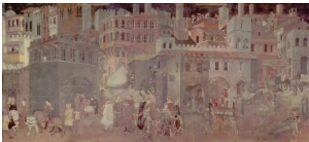
Figure 1 : Fresque des effets du bon gouvernement de Sienne (mur est), la ville.

Autre élément, les images. Si l'opposition entre le régime iconique de l'urbain (l'idéogramme antérieur au 14 e siècle) et une nouvelle représentation de la ville à partir des fresques de Sienne a été constatée depuis longtemps déjà (Chevalier 1981), le travail a été largement développé par Philippe Cardinali (2002), dont on reproduira ici quelques conclusions. Pour celui-ci, la première figuration de la ville en tant que telle, avec une véritable fonction de représentation, et pas simplement de signification, correspond aux fresques du palais communal de Sienne d'Ambrogio Lorenzetti, peintes vers 1337-1339, et notamment à celle des effets du bon gouvernement (Figures 1 et 2). Après avoir examiné plusieurs images montrant des villes aux 12 e et 13 e siècles, notamment les chapiteaux du cloître roman de l'abbaye de Moissac et les peintures des primitifs italiens tels que Duccio et Giotto, Philippe Cardinali en arrive à distinguer deux régimes iconographiques différents. Le premier, antérieur à Lorenzetti, et qui est considéré comme « médiéval » par Cardinali, est une figuration symbolique de l'agglomération urbaine, iconique, très stylisée (figuration d'un mur ou d'une porte pour renvoyer à l'ensemble urbain) qui suggère l'espace urbain de manière métonymique, non pas pour le re-présenter mais le signifier (ce qu'il appelle la « représentation délomique »). Pour lui, l'image du christianisme médiéval vise à montrer l'essence des choses, non pas à jouer avec leurs apparences.