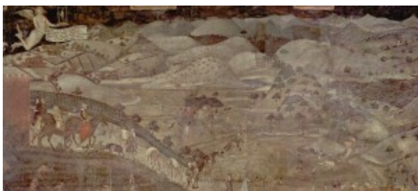
Figure 2 : Fresque des effets du bon gouvernement de Sienne (mur est), la campagne.

Au contraire, à partir de Lorenzetti, on a une représentation qui se veut mimétique, même si elle ne