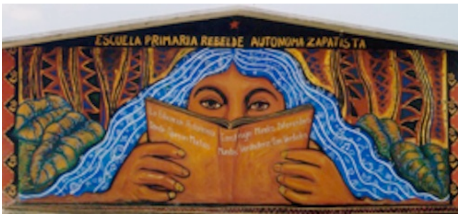
Figure 1. Photo d'une école primaire en territoire autonome zapatiste (Stéphane Guimont Marceau, mai 2004).

Sa principale stratégie est composée de communiqués de presse largement diffusés aux échelles locale, nationale et internationale (Galland, 2008). Le récit qui nous intéresse s'insère dans cette diffusion. Le mouvement zapatiste a sans doute été le premier mouvement social à utiliser Internet de façon massive afin de propager son message à l'échelle transnationale. Cette stratégie leur a servi : le mouvement jouit, dès les premiers jours de son insurrection, d'un fort niveau de sympathie qui oblige le gouvernement mexicain à s'asseoir avec lui pour négocier. Depuis, les dirigeants du mouvement misent sur les médias écrits, radio et vidéo, pour apparaître dans une sphère publique de laquelle ils étaient exclus.