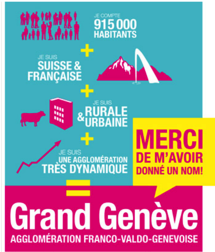
Figure 4?: Affiche « Je suis le Grand Genève ».

Le territoire et son projet se précisent et se fixent ainsi à travers la succession de ces «?informels manifestes?» (Duran et Thoenig 1996, p.?603). Chaque document s’appuie sur les précédents et contribue à resserrer un peu plus le champ des possibles. Le thème est repris mais aussi transformé, à travers des mécanismes d’intertextualité[9]. On retrouve, en effet, dans les uns les formules inventées pour les autres, des paragraphes, des idées, qui transitent et tissent le fil d’un récit qui s’impose progressivement comme l’histoire officielle du projet. Mais chacun introduit également une évolution. Le territoire et son projet se transforment et se renouvellent continuellement, au fil des échanges et des produits. L’intertextualité?nourrit ainsi la construction d’une ritournelle interne, faisant apparaître la production des différents documents comme autant de cycles de réinterprétation?ou de recommencement.