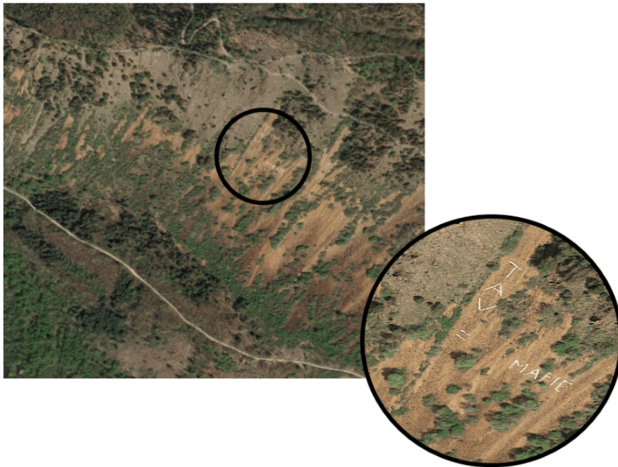
Figure 2. La lutte No TAV inscrite sur les pentes du Monte Musinè, à l'entrée est du Val de Suse, face à Avigliana. – coordonnées géographiques : 45.110898°N, 7.441446°E.