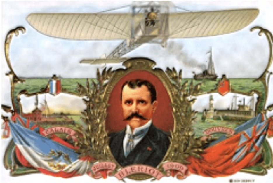
Image 1 : Le culte de Louis Blériot en carte postale, 1909

On peut étendre cette analyse à l'échelle internationale. En effet, l'aéroplane n'était pas un sujet populaire qu'en France. Depuis le premier vol, le 17 décembre 1903 aux États-Unis, des frères Wilbur et Orville Wright (1867-1912 et 1871-1948), la chose aérienne était devenue un sport internationalement pratiqué, au sujet duquel la presse mesurait la puissance d'une nation sur les autres. Le poète belge Émile Verhaeren (1855-1916) confirma le lien entre nationalisme et aviation lors d'un déjeuner auquel participait, en 1910, le collectionneur allemand Harry, comte de Kessler (1868-1937). Ce dernier rapporte dans son journal : « Verhaeren über den jetzt hier grassierenden Chauvinismus [Verhaeren parlant du chauvinisme qui prospère ici aujourd'hui] : c'est l'aéroplane qui l'a fait éclater ; c'était préparé, mais ça a éclaté d'un seul coup, comme les bombes, après le Circuit de l'Est.[20] ». Dans l'atmosphère de plus en plus nationaliste et militariste qui régnait en Europe, l'aviation devint un des fleurons du réarmement de la plupart des pays européens.