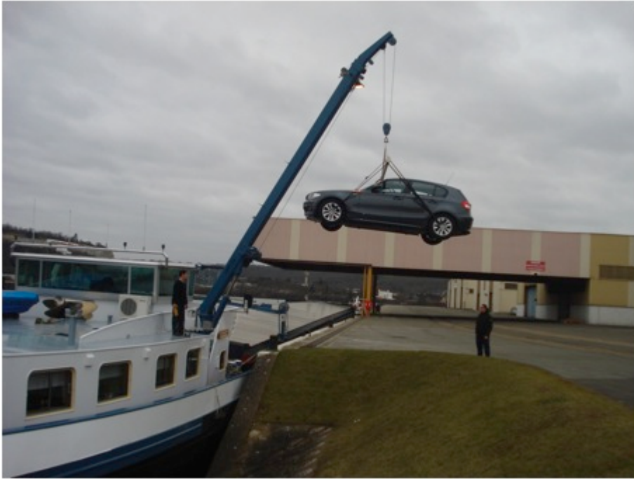
Photo 2 : Le débarquement de la voiture - port de Limay, C. PAUL, 2011.

Mais au-delà de ces entraves physiques, c'est toute l'organisation du travail, soumise à un ensemble de contraintes spatio-temporelles, qui limite fortement la pratique des villes même fluviales. Cette organisation réduit les opportunités d'interactions avec les « gens d'à terre », réduits aux échanges économiques. Comme nous l'avons développé précédemment, l'intérêt commercial prime devant les intérêts domestiques. Ainsi la nécessité de se ravitailler (approvisionnement alimentaire), qui pourrait constituer un temps de pratique de la ville, ne doit pas représenter un frein à la navigation. Les haltes liées à l'économie domestique coïncident toujours avec des arrêts de navigation imposés. En général, les bateliers mettent en œuvre des stratégies d'anticipation vis-à-vis de leurs habitudes quotidiennes et s'approvisionnent le week-end en grande quantité. Finalement, c'est à cela que se réduit souvent leur pratique de la ville. Une pratique ludique, récréative ou culturelle de la ville, au cœur de leur image d'attractivité (Hannigan, 1998) mais aussi de la ville « mobile, durable et policée » (Reigner et al, 2012), leur est largement étrangère. Toutefois, on observe aujourd'hui une légère inversion de la tendance liée d'une part à l'allongement de la scolarité et d'autre part à l'arrivée de bateliers non issus du milieu fluvial.