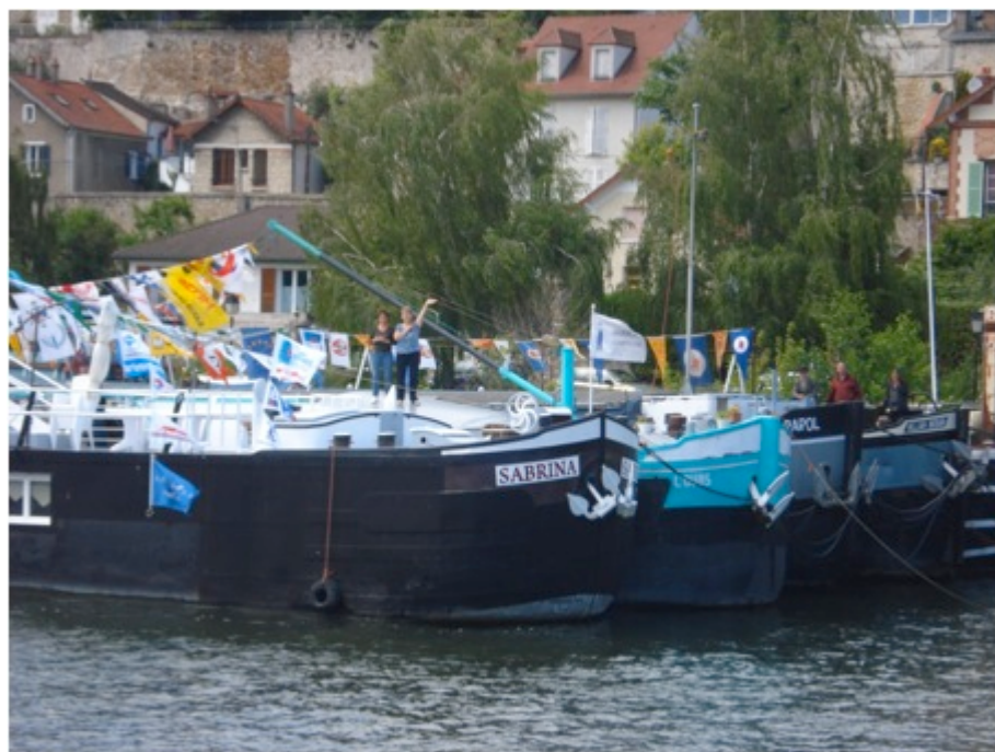
Photo 3 : Bateaux à quai à Conflans-Sainte-Honorine, C. PAUL, 2011.

Le débarquement est révélateur du besoin de se regrouper sur des lieux propres à eux.