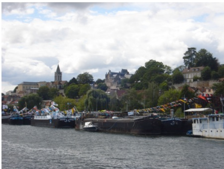
Photo 4 : Pardon de la batellerie à Conflans-Sainte-Honorine, C. PAUL, 2011.

cravates ayant généralement pour motif des ancres marines. Les plus aguerris revêtent quant à eux les anciens costumes des confréries des anciennes batellerie régionales. Ils revendiquent ainsi l'autonomie de leur groupe et marquent alors la rupture avec la population locale. La célébration du groupe socioprofessionnel et de son territoire n'est donc pas partagée avec les « gens d'à terre ». C'est un trait majeur de cette urbanité.