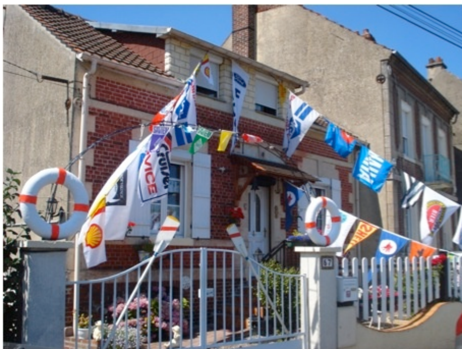
Photo 5 : Maison riveraine au canal latéral à l'Oise — Longueil- Annel (signes distinctifs : bouées, pavillons, ancre en haut à droite de la porte), C.PAUL, 2011.

La forme urbaine de Saint-Mammès est caractéristique de son appropriation. Un réseau de jardins bateliers s'étend derrière la façade sur quai. Il s'agit des lopins de terre que les bateliers ont exploités dès le 19 e siècle pour compléter leurs revenus. Malgré les crues, les bateliers ont fait le choix de construire leurs pavillons, lors de la débarque, sur ces terrains proches de l'eau. Le parcellaire est à l'échelle de l'espace exigü que les bateliers pratiquaient sur leur bateau. Les logements, en général de petite taille, ressemblent aux dimensions de ceux qu'ils possédaient sur leur bateau, et leurs jardins sont à la même échelle (Dabin, 2005). On reconnaît les maisons de bateliers par leurs signes distinctifs. Lorsqu'ils quittent leur embarcation, ils gardent en général quelques parties de leur bateau, en souvenir de leur activité professionnelle, qu'ils mettent en scène.