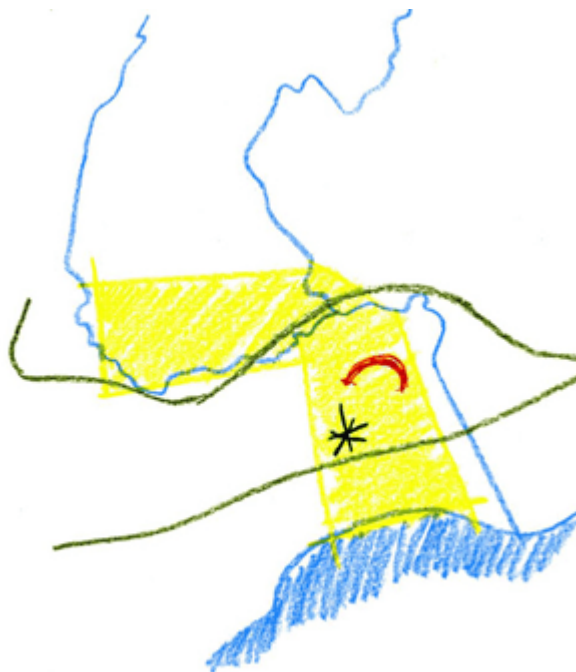
Illustration 4 : Exercice 3, hypothèses d'aménagement « Au fil du sport ».

Les étudiants sont mis ainsi en situation de pratiquer, pour la première fois, le principe du « projeter ensemble » qui caractérise la pédagogie de l'Enac. Ils doivent faire face à deux difficultés fondamentales de la conception interdisciplinaire : la construction d'un point de vue partagé et l'imagination concrète d'un futur possible. Il s'agira de développer, dans les hypothèses, une certaine vision de la vie dans le campus, en considérant qu'une intervention sectorielle doit dépendre d'une idée de l'ensemble : ici, dans la perspective d'une transformation de la signification et des prestations de l'ensemble du campus. C'est l'habitabilité du campus au sens le plus général de ce terme qui doit être mise au centre des préoccupations du groupe, dans le but de l'augmenter.