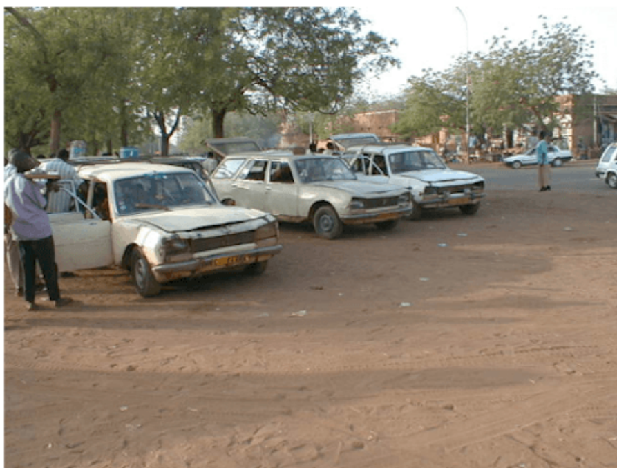
Taxi suburbain Talladjé-talladjé

La production des 505 s'était, en effet, arrêtée en 1992 et celle des 504 familiales, effectuées en Europe, fut stoppée en 1996. La berline 504 fabriquée à l'usine de Kaduna au Nigéria fut à son tour arrêtée en 2005. Désormais, l'activité confrontée aux problèmes de pièces de rechanges, à la vétusté du matériel roulant, au décès des premiers promoteurs qui disposaient de solides amitiés dans la police, au rajeunissement des éléments de la police, au prix prohibitif du carburant, entre autres, périclita. Entre 2001 et 2010, le nombre de taxis Talladjé-talladjé chuta de 45 à 20. Véritables épaves, ces véhicules offrent, cependant, 180 sièges à leurs passagers à chaque rotation. En moyenne, ce type de taxi faisait une vingtaine de rotations par jour au temps de leur grandeur. Aujourd'hui, extrêmement peu peuvent soutenir ce rythme à cause des pannes qui les obligent à faire souvent des crochets sinon à séjourner plusieurs jours dans les garages. Ils sont donc peu performants ; on estime que la moitié seulement de la flotte est mobilisable chaque jour. Dans un tel contexte, le résultat est une lutte pour la survie de l'activité. La vétusté des véhicules combinée aux pannes fréquentes et aux difficultés à obtenir des pièces détachées ont poussé certains propriétaires à vendre leurs véhicules à la casse où ils sont dépiécés. Ces pièces usagées permettent de redonner un second souffle aux tacots encore en activité.