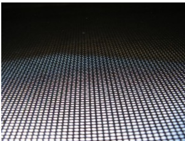
Figure 2 : Screen Pattern ( http://strange-shots.deviantart.com/art/Screen-Pattern-123101161).

Souligner ce processus éloigne le spectre de la standardisation 12 et du vide de l'expérience. Le remix est une re-crédation, autrement dit le résultat d'une refonte des séquences d'action 13 selon les circonstances et les styles 14 , qui confère une certaine fluidité aux expériences. Certes, les recompositions ont lieu dans des espaces tous complexes, mais avec des existants différents, des cours d'action différents et des mises en relations différentes. La compréhension du remix permettrait de démêler les mises en relation et les relations qui en résultent pour clarifier quelque peu les fils si intriqués de l'urbain contemporain et du monde que nous parvenons à soutenir. Le remix est la forme finie du flux urbain vécu et cette fluidité demande à chacun d'entre nous un travail infini et accéléré de remixage pour supporter la vie urbaine.