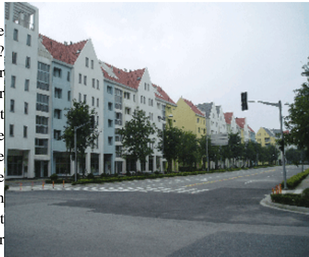
Abb.3: Wohngebäude mit gewerblichen Räumen im Parterre.

Was ist geschehen? Warum wirkt die transponierte Struktur so unanschaulich? Weshalb stellt sich nicht einmal ein Hauch der Atmosphäre heutiger deutscher Kleinstadtzentren in Anting ein? Hat dies damit zu tun, dass Albert Speer eigentlich eine moderne deutsche Kleinstadt bauen wollte, eine Stadt, die er in Deutschland so entwerfen würde (wenn man solche Städte in Deutschland noch bauen könnte)? Oder hängt es einfach damit zusammen, dass der Grundriss, obschon einer alten Grundstruktur huldigend, mit einer modernen Füllstruktur überzogen worden ist? Ist Anting Neustadt als deutsche Kleinstadt dem Shanghaier Baurecht zum Opfer gefallen? Oder ist Anting einfach noch zu neu, zu unbelebt, zu wenig von Bewohnern angeeignet?