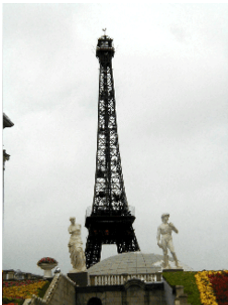
Abb. 22: Hyperreale Assemblage von Venus, David und Eiffelturm in Shenzhen.

Anders das 'Fenster der Welt' in Shenzhen. Hier geht es nicht um Traumwelten; es werden keine Fantasiegebilde oder bauliche Übertreibungen angeboten, sondern gleichsam dreidimensionale Fotografien prominenter Bauwerke aus nahezu allen geschichtlichen Epochen und von jedem Kontinent (außer der Antarktis) ausgestellt – das Ganze mit einer Garnierung aus Fontäne (100 m Höhe!), Matterhorn- und Fujiama-Imitaten und, nicht zu vergessen, 'Gottes Hand'. Zwar geht es auch hier um Emotionen, jedoch in abgewogener Form. Das Gegengewicht bilden Inhalte, die insbesondere an wissbegierige Kinder und Erwachsene vermittelt werden. Für Schulklassen ist 'Window of the World' ein beliebtes Ziel.