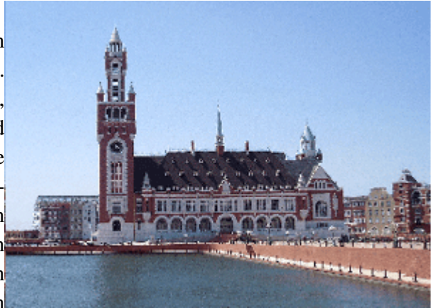
Abb.19: Rathauskopie in Shenyang.

Wenn man nach Neu Amsterdam kommt, dann geht man durch große unbewachte Torbögen. Die Fenster der meisten Gebäude wirken blind, die Farben stumpf und hier und da sind Rostflecken zu sehen. Selbst vollständige Fassadenfronten wirken wie Hollywood-Kulissen. In einigen Bereichen stehen halbfertige Gebäude inmitten von ausgedehnten Brachflächen. Nur wenige Menschen beleben tagsüber die im Sonnenlicht gleißenden Straßen und Plätze. Belebt ist eigentlich nur der Platz vor dem Bahnhof, von dem niemand mit dem Zug abfährt und an dem niemand mit dem Zug ankommt. Denn Gleise gibt es nicht. Woher kommen die Menschen?