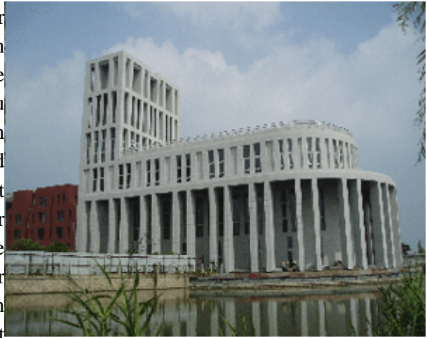
Abb.9: Die Kirche von Anting (GMP, im Bau).

In Anting Neustadt wurde das Prinzip der inklusiven Stadt naiv in einen exkludierenden kulturellen Kontext implantiert. So strauchelt die Inklusion über die Exklusion. Man hat sich zu wenig Rechenschaft darüber abgelegt, dass in China die Wohnsiedlung der Familie und Gemeinschaft gehört, der Handel bzw. Markt jedoch der offenen Stadt. Die Akzeptanz dieser Doppelstruktur wäre die Voraussetzung für eine gelingende Transposition räumlicher Begabungen aus Deutschland nach China. Den urbanen Code Chinas verstehen und ernst nehmen bedeutet nämlich, dass man sich aktiv gestaltend auf die Produktion räumlicher Hybride einlässt – anstatt nachzubessern. Doch dazu fehlte es offenbar an einem elaborierten Verständnis für den urbanen Code Chinas.