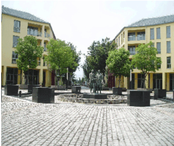
Abb. 10: Der Weimarplatz von Anting mit Kopie des Goethe- und Schiller-Denkmal.

Allzu entschieden denotieren sie europäische Extraversion.