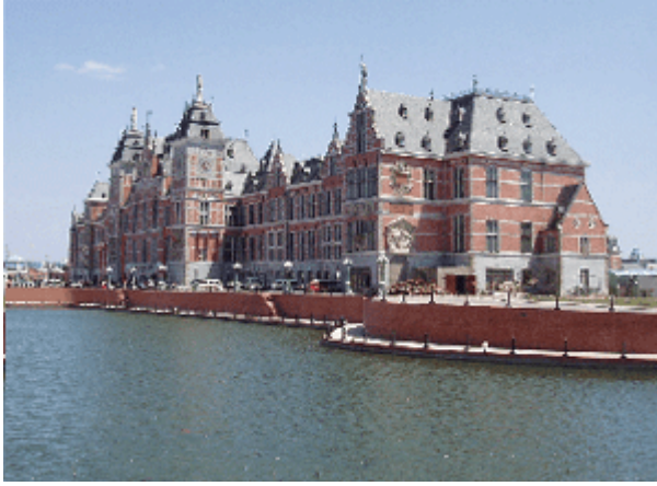
Abb. 20: Kopie des Hauptbahnhofs von Amsterdam in Shenyang.

So gibt es typische holländische Blockrand-Wohnhäuser, die auch als Wohnhäuser dienen sollen. Allerdings kommen, wie wir wissen, für das Wohnen nur solche Blockrandhäuser in Betracht, die eine Südorientierung aufweisen. Da jedoch die Vorgabe der totalen Fiktion umgesetzt wurde, kommt es zu einem Problem: Eine in Ost-West-Richtung verlaufende Straße bringt es mit sich, dass die Eingangstüren auf der einen Straßenseite im Süden, auf der anderen im Norden liegen. Für die südlich platzierte rückwärtige Front der niedrigen, nur zweigeschossigen Gebäude ergibt sich dadurch die Möglichkeit, die für die chinesische Familie wichtige Veranda (bzw. Balkon) nach Süden zu orientieren. Diese Seite ließe sich also vermarkten, wenn nicht straßenseitig auf den ebenfalls wichtigen Nordbalkon verzichtet werden müsste. Man muss nämlich wissen, dass sich die Nordbalkone auch im Zeitalter des Kühlschranks, das in China längst angebrochen ist, als Ort der Aufbewahrung von Lebensmitteln und als willkommener Stellplatz für Waschmaschine oder Vergleichbares großer Beliebtheit erfreuen. Man mag auf sie nicht verzichten.