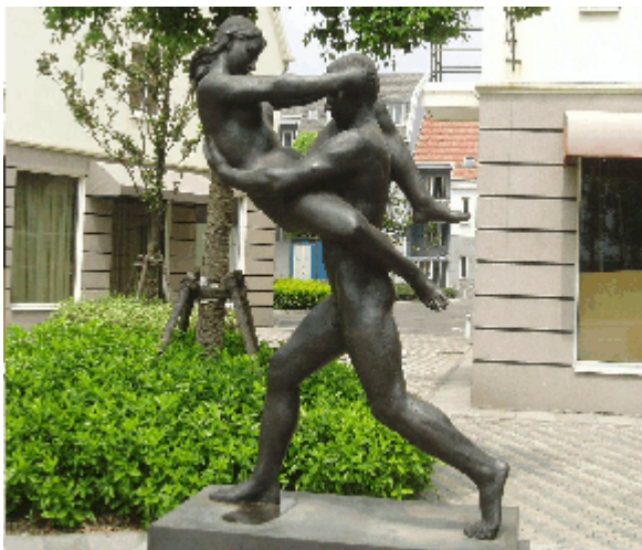
Abb.17: Nacktheit als Markenidentität von Luodian, Shanghai.

Den nordischen Stil soll man vor allen Dingen an der emblematischen Verwendung von Mansardgiebeldächern erkennen. Diese sind hier und da durch Satteldächer, Walmdächer und andere, meist von Mansardgiebel- und Walmdächern abgeleitete Dachformen ergänzt worden. Als weiteres Merkmal des Nordischen wird offenbar die Ausstattung mit Bronzeskulpturen nackter Männer, Frauen und Kinder angesehen. Nackte Menschen werden schon durch die bloße Häufigkeit zum Markenzeichen von Luodian. Offenbar soll Skandinavien bzw. Schweden mit Freikörperkultur assoziiert werden – oder vielleicht wird es ohnehin damit in Verbindung gebracht (?). Auf alle Fälle hat sich im Stadtzentrum bereits ein großer Sauna-Betrieb niedergelassen. Er machte zum Zeitpunkt der Besichtigung allerdings einen verwaisten Eindruck, war geschlossen und die Anzeigetafeln verblasst.