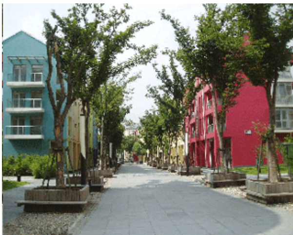
Abb. 12: Verkehrsberuhigte Allee mit Mischnutzung, Anting.

Bei aller Kritik sollten jedoch die positiven Anliegen und vor allem die Verdienste der Verantwortlichen nicht übersehen werden. Für uns beginnt die Liste der Errungenschaften damit, dass mit dem Realexperiment Anting Neustadt dem West-Ost-Dialog (bzw. dem Deutschland-China-Gedanken- und Erfahrungsaustausch) ein unbezahlbar wertvolles Erfahrungsobjekt zur Verfügung gestellt wurde (von dem nicht zuletzt dieses Buch profitiert). In der Auseinandersetzung mit diesem Experiment konnten interkulturelle Aufmerksamkeit geschärft und das Wissen um den urbanen Code Chinas vertieft werden. Dass dieses Argument nicht nur für uns gilt, zeigt die große Welle an Sekundärliteratur, an Büchern, Aufsätzen, Zeitungsartikeln, Blog-Beiträgen etc. welche das Projekt ausgelöst hat und immer noch auslöst.