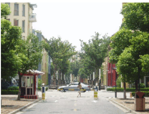
Abb. 5-8: Abschließen oder nicht abschließen? Pseudo-Tore in Anting, Shanghai.

Noch allerdings ist es nicht so weit. Das Stadtzentrum befindet sich im Bau und bereits jetzt ist man dabei, zu korrigieren und nachzujustieren. Es ist daher absehbar, dass sich Anting Neustadt allmählich sinisiert – in dem Sinne, dass am Ende ein aufgeschlossenes Stadtzentrum vorfindbar ist, dass über zwei bis vier offene Zufahrtsstraßen erreichbar ist. Der ganze Rest, gegenwärtig noch offen bzw. nur symbolisch geschlossen, würde dann in Nachbarschaften aufgeteilt und verriegelt sein. Welche Konsequenzen eine derartige räumliche Zäsur für den einheitlich entworfenen Stadtgrundriss nach sich ziehen würde, vermag man sich nur schwer vorzustellen.