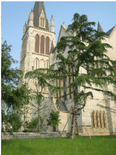
Abb.15: Kopie einer Kathedrale in Taiwushi.

Für die Wohnquartiere gilt ansonsten: Sie sind verriegelt, d.h. mit ordentlichem Zaun, Wärterhäuschen, Schlagbaum, Videokameras, Infrarotmelder und allem, was zu einer ordentlichen Exklusion dazu gehört, ausgestattet. Sie sind orientiert, d.h. die Wohngebäude richten sich allesamt nach Süden aus. Ein Blockrandproblem gibt es, von Ausnahmen abgesehen, nicht. Sie sind schließlich introvertiert, d.h. mit Nachbarschaftshöfen bzw. introversen Parkanlagen ausgestattet. An Großbritannien erinnern in diesen Bereichen außer der Bekleidung des Wachpersonals nur noch die Ausstattung der offenen Erschließungsstraßen mit den bekannten roten Giles G. Scott-Telefonzellen, ebenfalls roten Postboxen, Feuermeldern etc.