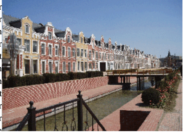
Abb. 21: Fiktionale Grachtenhäuser in Shenyang.

In Neu Amsterdam ist nichts eindeutig. Der Haupteingang gibt sich wie das Tor zu einer Nachbarschaft. Doch andererseits gibt sich dieses Quartier als thematische Stadt im Stile der Shanghaier Neustädte. Der ganze Stadtraum ist als geschlossener Raum konzipiert. Die als offen inszenierten Bereiche sind somit im Prinzip auch geschlossen. Andererseits gliedert sich die Stadt in mehrere Nachbarschaften, darunter Villenquartiere, multiple Quartiere (nach Art der stufenförmigen Bebauung), Hochhaus-Quartiere und, nicht zu vergessen, in den fiktionalen Stadtkörper