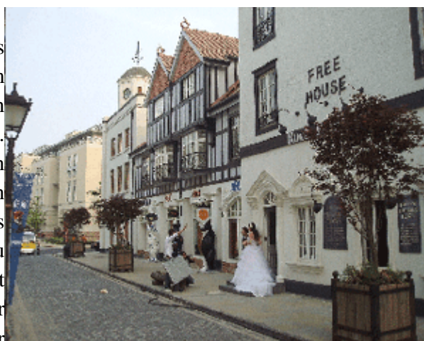
Abb.13: Straßenszene mit Hochzeitspaar in Taiwushi.

Ganz anders 'Thames Town', das angelsächsischen Pragmatismus aus jedem verbauten Molekül verkündet. Der Masterplan von Atkins lieferte, was der Kunde bestellt hatte. Der Kunde wünscht das Bild der englischen Stadt? Nichts einfacher als das! Es werden altenglische Architekturen und Ensembles fotografiert, gefilmt, gescannt, kompiliert und zu einer Stadt synthetisiert. Der Kunde liebt barocke Anmutung? Kann er haben! So wird der Zentralplatz als idealer Rundplatz mit achsialer Öffnung zum See entworfen. Das Stadtfake wird sodann dem kommerziellen Stadtraum zugeordnet. Die Nachbarschaften werden säuberlich abgetrennt und mit der üblichen Sicherheitsinfrastruktur ausgestattet. Fertig ist 'Thames Town', die Travestie einer chinesischen Stadt.