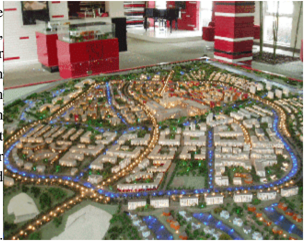
Abb.1: Modell von Anting Neustadt, Shanghai.

Während der erste Ansatz vor allem die Grundstruktur der projektierten Stadt betrifft, wirkt sich der zweite Ansatz auf die Füllstruktur aus. Beides, Grund- und Füllstruktur zusammen genommen ergeben das Bild der Stadt. Im Folgenden gilt unser Haupt-Augenmerk dem ersten Ansatz. Dazu versichern wir uns erst einmal der wichtigsten Elemente der Grundstruktur der europäischen Stadt. Es sind die folgenden: