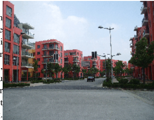
Abb.11: ‘Deutsche Stadt’ mit straßenseitigen Zeilenköpfen.

Durch die Streckung der Blöcke werden vorhandene Spielräume für die Gestaltung von Nachbarschaftshöfen eingeschränkt. Behält man jedoch die Blockrand-Bebauung, verstößt man gegen die Orientierungsregel. Werden die derzeit noch offenen Plätze durch nachträglich vorgenommene Verriegelungen in Nachbarschaftshöfe umcodiert, findet eine Vergemeinschaftung ihres öffentlichen (gesellschaftlichen) Charakters statt – eine riskante Form der Intimisierung von Orten mit identitätsstiftender Bedeutung für ganz Anting Neustadt.