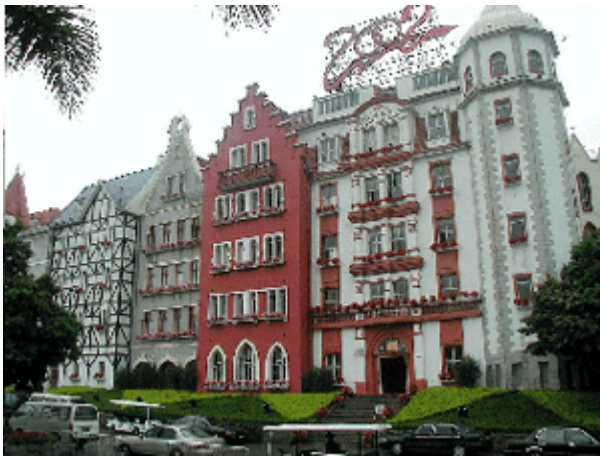
Abb.24: Europäische Stadtfiktion in Shenzhen.

Auf die besondere Situation, welche die fordistische bzw. funktionalistische Moderne für die urbane Mimikry mit sich brachte, wurde bereits wiederholt hingewiesen. (Hassenpflug 2000; Hassenpflug 2002) So hat der Funktionalismus in Architektur und Städtebau – in der Absicht, den gebauten Raum durch Zonierung und Beschleunigung effektiver zu gestalten – eine narrative Verarmung der Raumproduktion verursacht, welche für die fulminante Rückkehr der urbanen Fiktionen entscheidend wurde. Es konnte gezeigt werden, dass die Erlebnisindustrie den entstandenen Mangel an räumlichen Ästhetisierungen als erste identifiziert und in ein kommerziell zu befriedigendes Bedürfnis übersetzt hat. Die derart erkannte marktgängige Nachfrage nach Erlebniswelten befriedigte sie vorzugsweise durch Fiktionen der alteuropäischen Stadt mit ihren durch dekorierte Fassaden geschmückten öffentlichen Räumen. In China verbindet sich dieser kompensatorische Aspekt der Ästhetisierung mit einem unbändigen Interesse an Neuem, Fremdem, Exotischem, dass sich seit der Öffnung des allzu lange in sich gekehrten Landes Bahn brach.