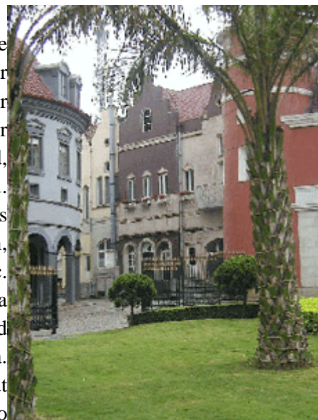
Abb.23: Europäische Stadtfiktion in Shenzhen.

Themenparks sind in China außergewöhnlich beliebt. Sie reflektieren eine Neugier an den Dingen, die man in ihrer Intensität eigentlich nur als radikale Negation einstiger Isolierung betrachten kann, eine Isolierung, welche weniger total war, als sie vielfach in diesem Lande dargestellt wird, die jedoch wie ein kollektives Trauma ausagiert wird. Isolationismus soll es nie mehr geben! Also wird alles, was die Welt an Schönem, Sensationellem, Verwunderlichem, Märchenhaftem, Beeindruckendem, Unverwechselbarem etc. zu bieten hat, fotografiert, gescannt, abgemalt, nach China transponiert, eins-zu-eins oder en miniature nachgebaut und mit staunenden Augen besichtigt. In China soll es derzeit ca. 1000 Themenparks geben. (Sheng, Haitao 2007). Hauptstadt derselben ist ohne Zweifel die Boomstadt Shenzhen, wo bereits 1989 der erste Miniaturlandschaftspark unter dem Namen ‘Prachtvolles China’ eröffnet wurde. Der beispiellose Erfolg dieses Parks löste den Themenpark-Boom aus, welcher China zum Weltmeister der fiktionalen Welten gemacht hat.