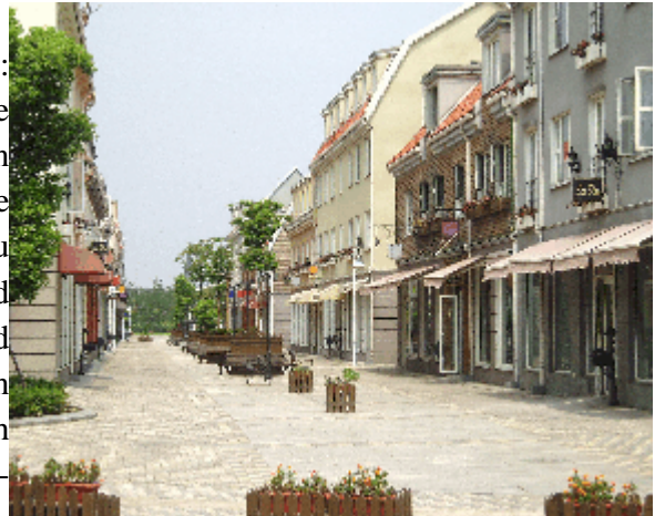
Abb. 18: Fußgängerzone ohne Fußgänger in Luodian.

Natürlich ist Luodian für Chinesen leicht lesbar: Hier die Nachbarschaft, dort, durch eine breite Straße und durch einen Kanal von den Wohnbereichen deutlich abgegrenzt, die Stadtfiktion als offener Raum. Im Unterschied zu Anting, wo die Ambivalenz von offenem und geschlossenem Raum die Serviceagenturen und Sicherheitsdienste offenbar nervös macht, kann man hier, ebenso wie in Taiwushi, nach Herzenslust die toten, mit Plastikblumen und -ranken animierten Fassaden fotografieren.