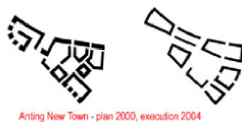
Fig. 2: Anting vorher – Anting nachher.

Das kulturelle Gewicht des Dualismus von abgeschlossener und aufgeschlossener Stadt bzw. der urbanen Dialektik von Exklusion und Inklusion, scheint den Planungen von vornherein äußerlich gewesen zu sein. Anting wurde als offene, funktionsintegrierte deutsche Stadt geplant. In der Mischung von Wohnfunktion und Handelsfunktion im offenen Stadtraum sollte offenbar das Ideal eines deutschen Lebensgefühls zum Ausdruck gebracht werden. Geschlossene Nachbarschaften waren nicht vorgesehen. Der breite Wassergraben, welcher die ganze Stadt umgibt, lässt sich jedoch als