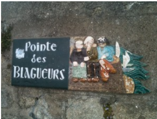
Image 1 : Pointe des blagueurs, Larmor-Plage (Morbihan).