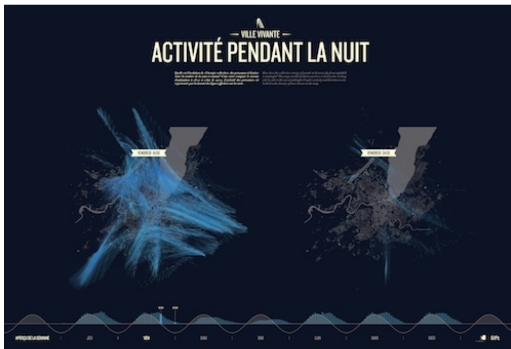
Image 7 : Empreintes numériques des téléphones portables Swisscom à partir du territoire de la ville de Genève, Activité pendant la nuit.

La figure ainsi proposée ne rappelle plus, ne représente plus une réalité fixe, mais présente à un instant précis l'état actuel d'un agencement empli de virtualités. Cette figure stratifiée et processuelle est aussi le résultat des mouvements des acteurs, qu'ils renseignent la figure ou bien qu'ils soient simplement inclus en elles. C'est la formalisation d'un agencement vivant.