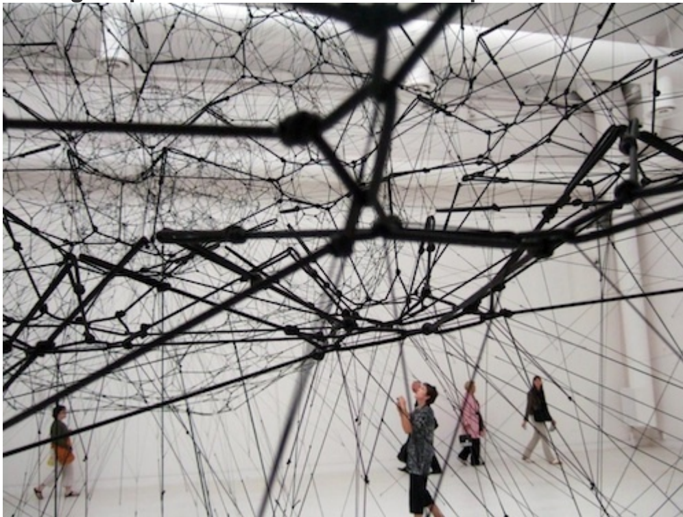
Image 8 : « Galaxies Forming along Filaments, Like Droplets along the Strands of a Spider's Web », Tomas Saraceno (2009)

La figure de la contre-ville est sans référent, indéterminée, diverse, devenir des interrelations des éléments entre eux. Les flux constituent une signature urbaine fluctuante et propre à chaque aire urbaine suivant les rapports entre le bâti et les mobilités, le solide et le liquide. Il n'y a pas plus d'urbain générique ou standard que de vivant standard ou générique, quand bien même le bâti est peu différenciable et les paysages urbains se font écho les uns aux autres. Les mouvements et les