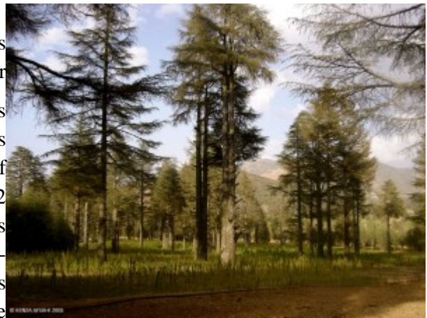
Image 1 : Champ de cannabis dans une cédraie du Rif central.

Le cannabis 1 est cultivé depuis plusieurs siècles dans le Rif central au Maroc, lequel s'étend sur environ 20 000 km 2 . C'est une des régions les plus marginalisées et les plus sous-développées du royaume. Plus des deux tiers du nord du Rif central étaient sous protectorat espagnol de 1912 à 1956, là où les massifs sont les plus montagneux et les plus boisés (cèdres, chênes-lièges, sapins, etc.) (Grovel 1996). Les premières tribus cultivatrices de Ketama et de Ghomara ne disposaient que de quelques dizaines de kilomètres carrés de culture de cannabis sur la commune de Ketama, dans la province d'Al Hoceima, et sur celle de Bab Berred, dans la province de Chefchaouen. Par la suite, et en plusieurs phases, cette surface s'est agrandie jusqu'à dépasser les frontières du Rif central et occuper plusieurs milliers d'hectares répartis sur cinq provinces de la région du Nord (Afsahi 2009).