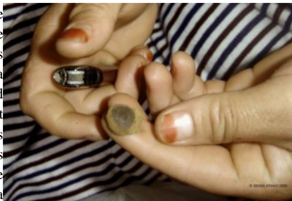
Image 3 : Mains d'une femme montrant un morceau de haschisch de qualité supérieure dans le « bled du kif ».

L'État a également participé à la création d'une identité spécifique par la tolérance historique de cette culture dans le Rif central. Les campagnes d'éradication du cannabis et de lutte contre sa propagation sur d'autres territoires du Nord (notamment dans la région de Jebala) permettent de comprendre cette dynamique. Les lançements de ces campagnes sont souvent accompagnés d'une classification que l'État opère, qui divise les territoires de culture en deux catégories : la zone historique et les nouvelles zones de culture 15 . Ces campagnes de lutte contre le cannabis, concernant en priorité les espaces nouvellement atteints par cette économie, ont permis au Rif central, et plus précisément aux Ketama et aux Ghomara (épargnés par cette politique en raison de l'enracinement de cette tradition agricole), de se forger une identité commune tout en valorisant les tolérances historiques. Par ailleurs, les Ketama et les Ghomara utilisent cette exception politique pour souligner l'authenticité et la « valeur ajoutée » du cannabis qu'ils cultivent par rapport à celui qui provient des autres territoires. Cette classification selon les zones de culture, devenue institutionnelle, cache en réalité des enjeux socio-économiques, des stratégies et des formes de résistance que les acteurs de l'espace historique de culture mobilisent pour élargir leur périmètre de culture (diffusion du savoir-faire, mobilité des acteurs, locations de terres, etc.).