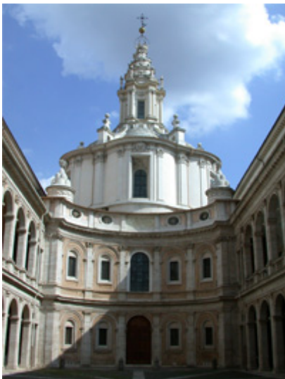
Sant Ivo dalla Sapienza, Rome.

La contrainte de la collection dans laquelle paraît l'ouvrage n'était certes pas faite pour intimider un écrivain aussi rompu aux gageures littéraires qu'Etienne Barilier. Comment l'homme qui a écrit un apocryphe biblique en grec ( L'énigme , 2001), réinventé le langage des premiers hommes ( La crique des perroquets , 1990), élucidé d'innombrables problèmes d'échecs et dont nous ne serions qu'à moitié étonnés d'apprendre qu'il a écrit des variations sur le motif musical B-A-C-H (dans la foulée de son magistral ouvrage éponyme [1997], et — pourquoi pas ? — dans le style d'Alban Berg, dont il a été le premier et aujourd'hui encore le meilleur biographe francophone [1978]...), comment donc cet auteur que l'Oulipo devrait nous envier, et qui n'a pourtant jamais rien écrit de gratuit, aurait-il pu être gêné de remplir à la lettre le contrat l'obligeant à livrer dans les 124 pages réglementaires l'exacte quintessence d'une recherche à la fois parfaitement informée et étonnamment neuve ?