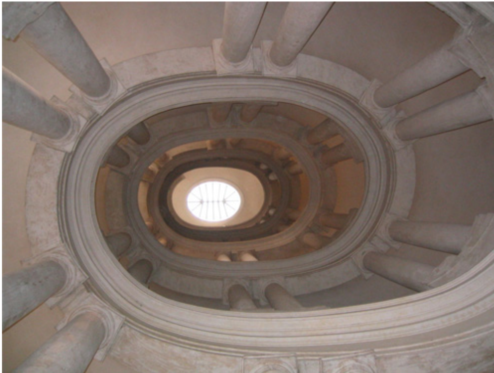
Escaliers intérieurs, Palais Barberini, Rome.