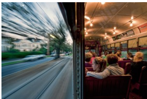
Photo 1 : Le tramway de La Nouvelle-Orléans (Louisiane/États-Unis) Traversée de quartier sur l'avenue St Charles. (Capt. By Don Chamblee 2011 - Nat. Geo. Cont., Boston Globe Picture, capt. 19 mars 2012).

Le 2 septembre 2012 devait voir renaître une course populaire et mythique : la traversée de Paris à la nage. Lancée en 1905 et rééditée jusqu'à la Seconde Guerre mondiale, cette manifestation a finalement été interdite par la préfecture de Paris. Les arguments invoqués tenaient à la pollution de l'eau et à la concurrence d'autres formes de mobilités fluviales. Les conditions de ce défi autant que son invalidation politique soulèvent d'emblée plusieurs questions.