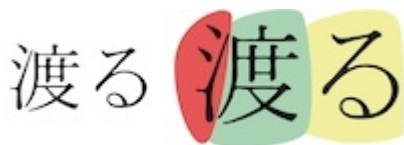
Figure 4 : Le Kanji japonais pour dire « traverser » (Wataru).

L'ensemble construit bien un espace bi-dimensionnel dont la croix est le point de convergence. En référence au « diathigè » démocritéen, nous proposons d'appeler diatigisation ce processus de mise en relation, soit les interspatialités dans lesquelles se coordonnent les espaces du traverser. Les espaces s'organisent de proche en proche à partir de l'individu ou du groupe social et la traversée se réalise dans une proximité. Nous soutenons ainsi l'idée selon laquelle il n'y a de traversée que locale. Nous sommes bien ici dans un espace non euclidien, dans lequel le local n'est pas ce que l'on peut croire dans un plan de base. Tout amène alors à interroger la « distance ».