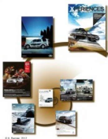
Figure 3 : Du tous espaces au tout-espace : un agencement hélicoïdal des images associées aux 4X4 dans la publicité envisagé comme gradient d'intensité du traverser (Source des images : campagnes de publicité parues dans la presse 2010/2012).

mouvement figurée par les tubes de glace à l'arrière de la voiture. Traversées singulières, traversées exceptionnelles, traversées réitérées sur la carte du traverser (Figure 2).