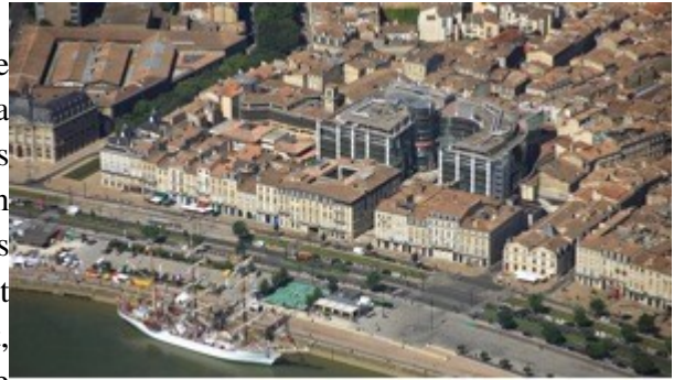
Image 2 : La Cité mondiale du vin, quai des Chartrons, accueille le commissariat de la série Section de recherches de TF1. Capture d'écran effectuée en janvier 2012.

Dans Famille d'accueil , le parti pris de référencement spatial par le réalisateur dans la fiction a évolué : dans les premières saisons, les références explicites à Bordeaux et à son agglomération étaient particulièrement discrètes et seuls les téléspectateurs locaux pouvaient reconnaître le panneau de la gare de Blanquefort, commune de l'agglomération, dans le générique du DVD de la série, ou des lycées de la périphérie bordelaise (Lycée des Iris à Lormont, Sud Médoc au Taillan-Médoc). Dans les deux dernières saisons, la ville de Bordeaux apparaît de manière explicite dans la narration. Les plans du centre-ville se sont multipliés, ancrant spatialement la série. Cette évolution a un sens : l'identification de Bordeaux par le spectateur est devenue signifiante, elle apporte une valeur ajoutée à la série, qui compense la plus-value financière que constituent les tournages en centre-ville.