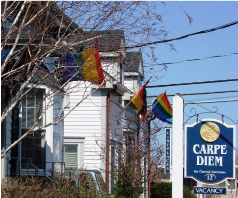
Maison d'hôte gay à Provincetown, Ma (États-Unis).