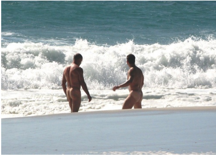
Plage naturiste gay de Sandy Bay, Le Cap (Afrique du Sud).

Le tourisme offre aux gays un espace-temps de relâchement par rapport au respect de la loi et des normes et plus généralement par rapport à la pression hétérosexuelle. Il participe ainsi à l'élaboration d'une identité et d'une culture gays dans laquelle la sexualité est fondamentale. Plus généralement, on peut avancer que la recherche de l'identité gay est elle-même une forme de tourisme, car elle nécessite le déplacement. Bien sûr, il faut dissiper le mythe selon lequel les gays seraient des prédateurs sexuels qui voyagent seulement pour avoir des aventures sexuelles (Clift et Forrest, 1999). La sexualité dont il a été question ici dépasse largement les seules relations sexuelles. Elle participe de la récréation (Équipe Mit, 2002 et 2005 ; Stock et al. , 2003) individuelle et collective des gays. Nous avançons que la prise en compte de la dimension sexuelle du voyage enrichit la compréhension du tourisme. De plus, le tourisme permet la (re)production du fantasme de lieux comme paradis gays. Les pratiques touristiques gays travaillent à satisfaire ce désir ardent de lieux autres, contribuant à la formation d'une culture gay internationale (Bell et Binnie, 2000).