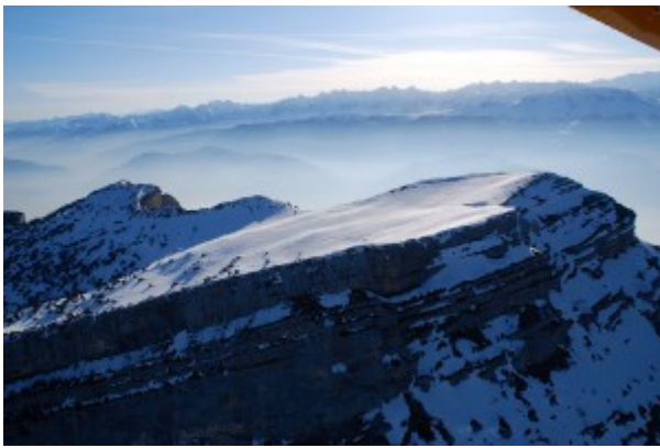
Photo 1 : Vue aérienne de la Dent de Crolles (Massif de Chartreuse).

Par Yohann Rech et Jean-Pierre Mounet. Le 7 janvier 2014