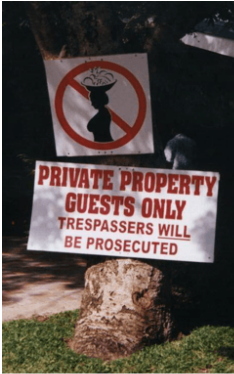
Document 3 : L'entrée d'un hôtel à St Lucia, ou la perpétuation du droit d'admission réservé.