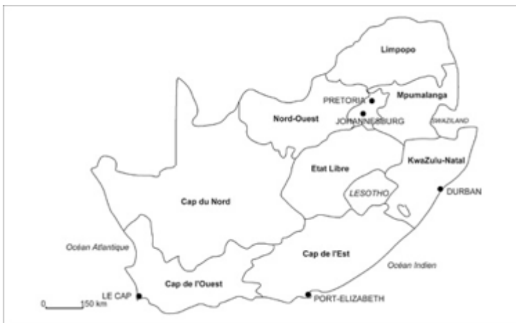
Carte 1 : Afrique du Sud.