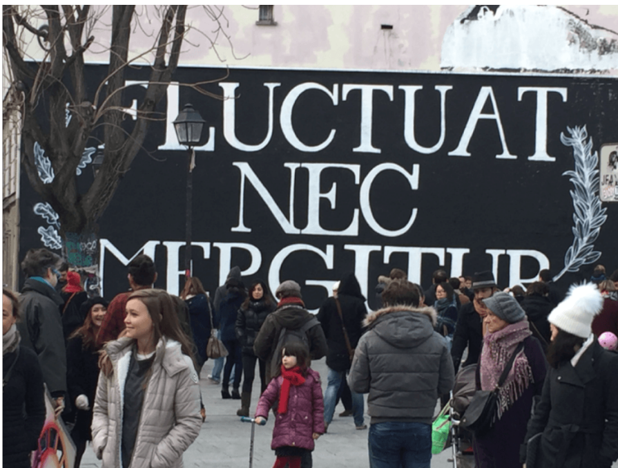
Figure 1 : Paris 10e arrondissement, après les attentats du 13 novembre 2015.

Les attentats parisiens du 13 novembre constituent un événement mondial à plusieurs titres : des attentats commis par un groupe multinational dans une ville-Monde, un crime contre l'humanité, un retentissement planétaire. Comme souvent, ce qui est mondial est aussi interscalaire et nous parle aussi de ce qui n'est pas mondial, ici : Paris, la France, l'Europe. Ces échelles entrelacent une multiplicité de métriques et beaucoup d'entre elles se déploient dans l'événement, un fait social total de la société-Monde.