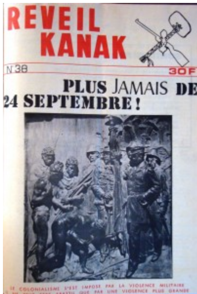
Photo 1 : La dernière couverture de Réveil Kanak en 1973. Depuis, l'orthographe a changé. Il est sous-titré par une maxime

fanonienne : « Le colonialisme militaire et ne peut être abattu que par une violence plus grande » (ibid.),