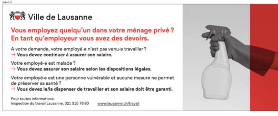
Figure 2 : Information de l'inspection du travail (ville de Lausanne) paru dans Le Courrier du 15 mai 2020.

Le Courrier , dont la rédaction est basée à Genève, a fait quant à lui paraître cet avis officiel de la Ville (voisine) de Lausanne, sachant que ce rappel à la loi valait aussi pour les résidents et citoyens genevois :