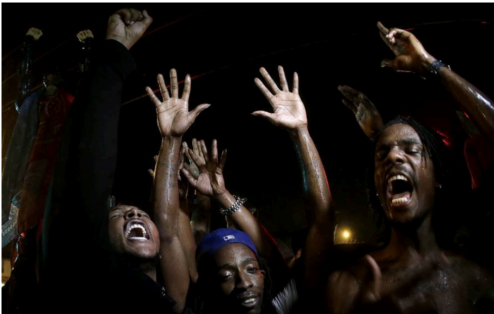
Photographie 17 : une scène de transe collective.

Similairement dans la Weltanschauung pentecôtiste le corpus mysticum et le sacrum imperium se sont projetés dans le marché. Ce car de sa pneuma émane invariablement la plénitude de puissance du Christ, qui dorénavant fait découler le salut de l'amour de l'argent propre au culte du capitalisme. Jung avait semblablement associé, en la déité du temps grec Aïon, l'éternité et l'autonomie en l'archétype du Christ. La félicité observée s'expliquerait ainsi par la sensation d'éternité qui saisit chaque fidèle à mesure qu'ils s'arrachent aux déterminismes anxiogènes. Ainsi cette lecture jungienne nous permet d'expliquer d'une part la dissipation de l'angoisse, fût-elle partielle. D'autre part perçoit-on dans l'association iconoclaste du Christ au capitalisme la persistance du théologico-politique relevée par Marcel Gauchet (qui procède donc paradoxalement d'une sortie du religieux et de « l'éclipse du politique »). La béatitude observée s'expliquerait ainsi par la sensation d'éternité qui saisit chaque fidèle à mesure qu'ils s'arrachent aux déterminismes anxiogènes.