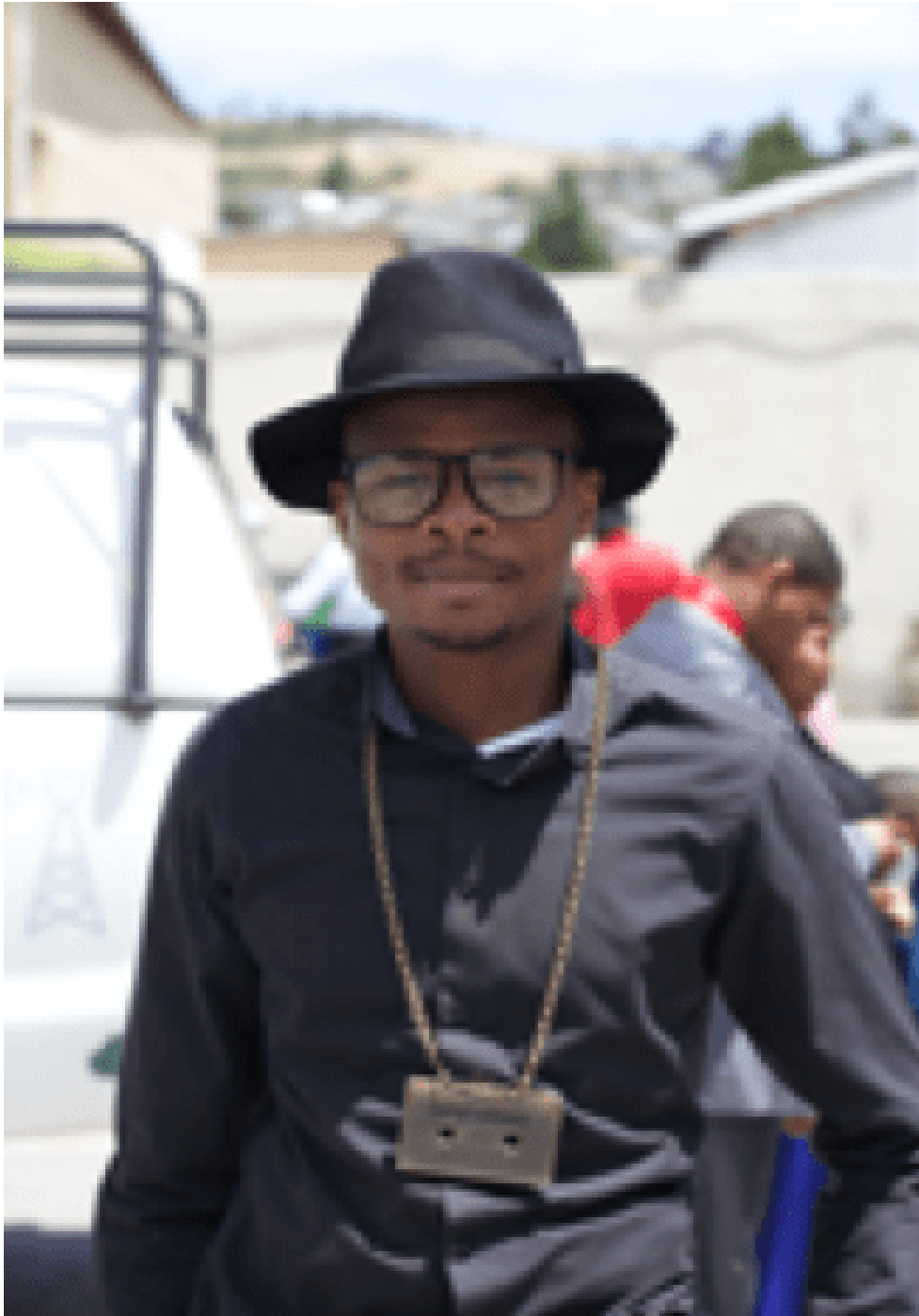
Photographies 10, 11 et 12 : podium de la Funny dressing competition.

À travers l'exemple du « pouvoir transformationnel du jeu », Erving Goffman développe sa pensée en théorisant le concept clef de modélisation. Lorsque des enfants s'amuse aux cow-boys et aux indiens, ils jouent en définitive à la guerre – ils prennent modèle sur la guerre- mais en abandonnent la plupart des attributs et des caractéristiques. Il ne viendrait pas à l'idée de l'un d'entre eux de s'en prendre gravement à un camarade ; tout comme il ne viendrait pas à l'idée d'un parent, observateur du jeu, de s'inquiéter pour la santé de son enfant : « ils ne font que jouer ». Ils appliquent à un contenu déjà signifiant -cadre primaire- un schéma d'interprétation partagé qui donne son sens à la modélisation. Ainsi, l'auteur entend par mode :