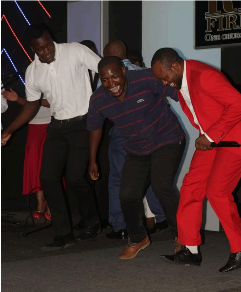
Photographie 5 : une scène de danse impromptue dans le hall qui sert d'Église de la Revival Fire Ministries, Kayamandi, Stellenbosch.