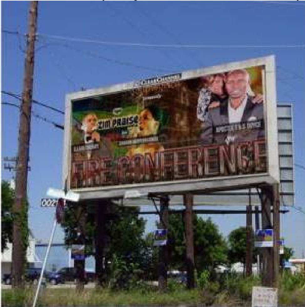
Photographie 9 : une affiche de la RFM dans la périphérie de Stellenbosch.