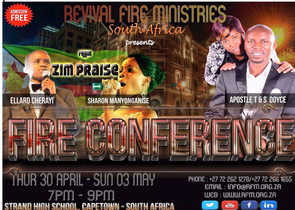
Photographie 14 : Flyer flamboyant et alléchant d'une « conférence » gratuite.