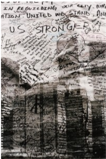
Illustration 7 : Grand panneau à écrire mis à la disposition des passants, New York (2001).

Il en va ici comme de nombreuses formes d'écriture collectives typiques, celle des pétitions, par exemple.