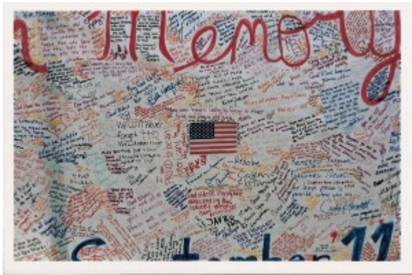
Illustration 6 : Légende. Source : Grand panneau à la mémoire des morts du 9/11, New York (2001). Source : Béatrice Fraenkel.

entre le « We » des énoncés et la signature individuelle pouvait être source de confusion, mais ramenés à leur réalisation graphique, les énoncés écrits sur les panneaux, banderoles, registres rendent visibles une sorte de marqueterie d'écritures et de signatures, qui a la particularité de pouvoir être vue comme l'œuvre d'un collectif et comme l'agrégat de plusieurs signes individuels.