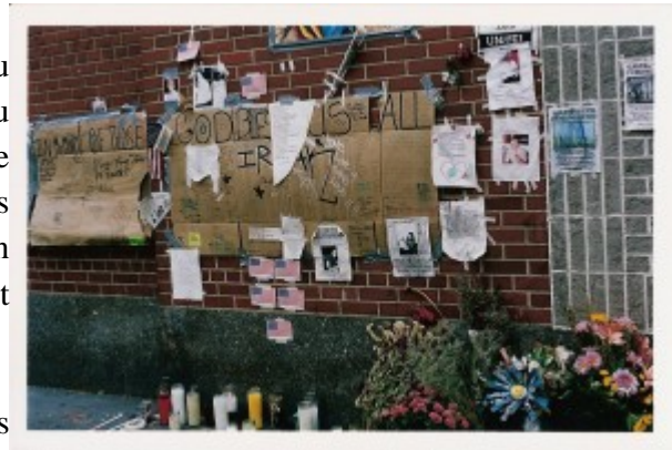
Illustration 3 : Fragilité des écrits. Avenue A, New York (2001).

On les trouve placardés à hauteur d’homme, ou bien regroupés en panneaux, en banderoles ou encore assemblés dans des autels où ils se mêlent aux fleurs, aux bougies, à un fouillis inextricable d’objets où voisinent ours en peluche, casque de pompier, drapeaux, images et rubans.