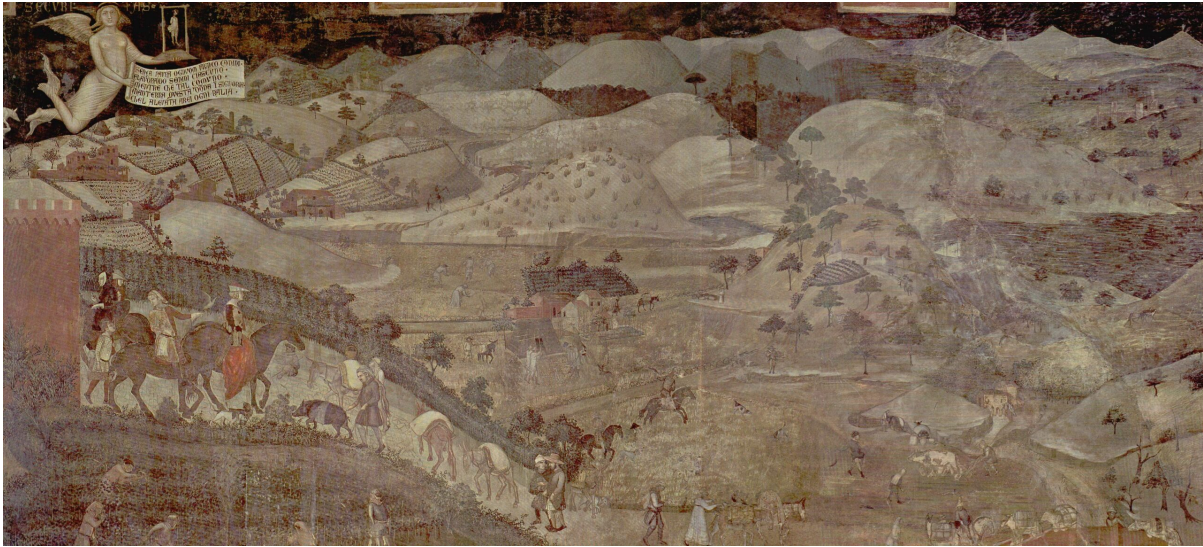
Figure 2 : Fresque des effets du bon gouvernement de Sienne (mur est), la campagne.

Au contraire, à partir de Lorenzetti, on a une représentation qui se veut mimétique, même si elle ne l'est pas : si elle fourmille de détails réalistes, ceux-ci restent soumis à l'idéologie du Bon gouvernement (Boucheron 2005). Cependant, la différence avec le régime iconique précédent tient au fait que la représentation, non pas soit plus réaliste, mais se prétende plus réaliste. Surtout, elle prend véritablement comme sujet la ville elle-même, en la mettant au centre, et ne se contente pas de la faire figurer comme un décor dans l'avant ou l'arrière-plan. Même chez Giotto, qui meurt au moment où débute la peinture des fresques siennoises, la peinture de la ville n'occupe qu'une bande spatiale, plus ou moins large, mais toujours bornée en profondeur et ressemblant à un proscenium 10 de théâtre, en restant dans un espace limité. S'il arrive à bien figurer des ensembles de construction d'ampleur restreinte, il échoue à représenter la ville dans son ensemble avec la même crédibilité. Chez Ambrogio, en revanche,