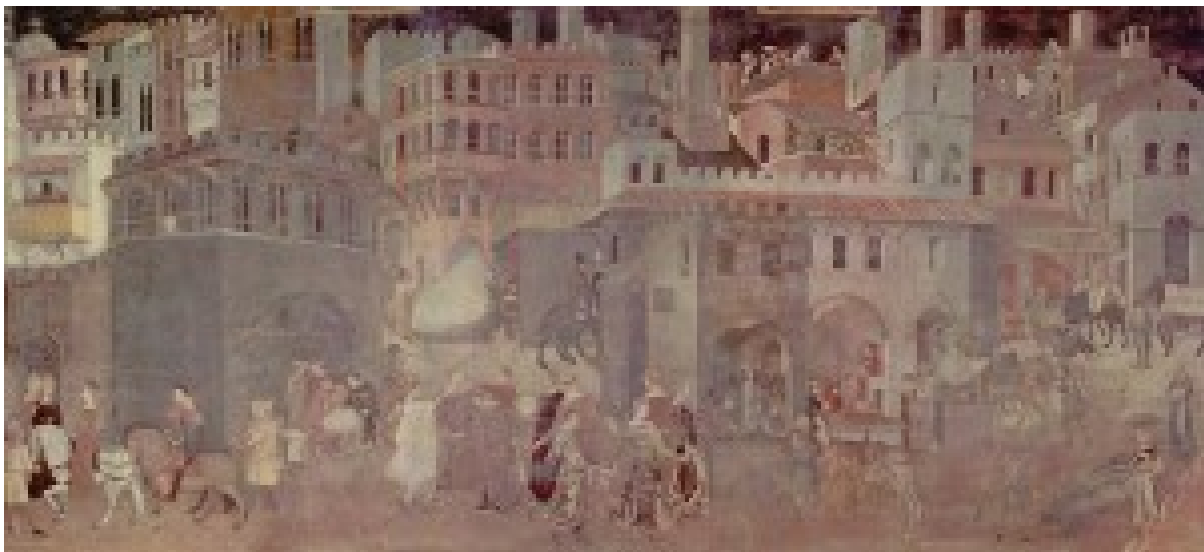
Figure 1 : Fresque des effets du bon gouvernement de Sienne (mur est), la ville.

Autre élément, les images. Si l'opposition entre le régime iconique de l'urbain (l'idéogramme antérieur au 14 e siècle) et une nouvelle représentation de la ville à partir des fresques de Sienne a été constatée depuis longtemps déjà (Chevalier 1981), le travail a été largement développé par Philippe Cardinali (2002), dont on reproduira ici quelques conclusions. Pour celui-ci, la première figuration de la ville en tant que telle, avec une véritable fonction de représentation, et pas simplement de signification, correspond aux fresques du palais communal de Sienne d'Ambrogio Lorenzetti, peintes vers 1337-1339, et notamment à celle des effets du bon gouvernement (Figures 1 et 2). Après avoir examiné plusieurs images montrant des villes aux 12 e et 13 e siècles, notamment les chapiteaux du cloître roman de l'abbaye de Moissac et les peintures des primitifs italiens tels que Duccio et Giotto, Philippe Cardinali en arrive à distinguer deux régimes iconographiques différents. Le premier, antérieur à Lorenzetti, et qui est considéré comme « médiéval » par Cardinali, est une figuration symbolique de l'agglomération urbaine, iconique, très stylisée (figuration d'un mur ou d'une porte pour renvoyer à l'ensemble urbain) qui suggère l'espace urbain de manière métonymique, non pas pour le re-présenter mais le signifier (ce qu'il appelle la « représentation délomique »). Pour lui, l'image du christianisme médiéval vise à montrer l'essence des choses, non pas à jouer avec leurs apparences.