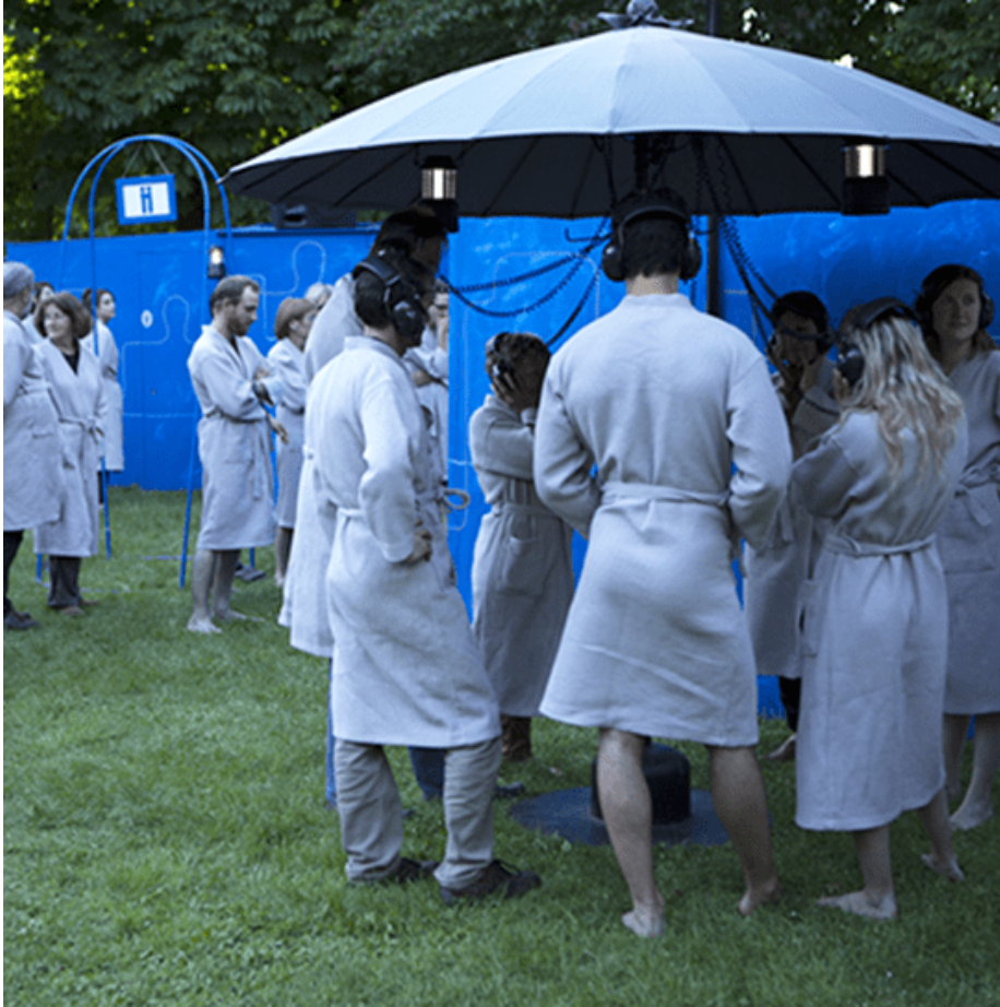
Devêtu(e), © Vincent Muteau.