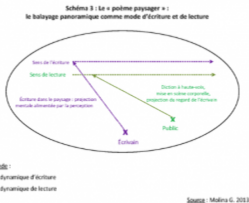
Schéma 3 : Le « poème paysager » : le balayage panoramique comme mode d'écriture et de lecture.

La poésie de Jacques Jouet s'ancre et se produit donc à partir d'une actualité, celle d'un lieu vécu à un instant donné par l'auteur. L'expérience sensible du lieu devient le moteur d'une écriture instantanée. Confrère du « poème de métro », le « poème paysage » s'écrit lui aussi « en direct », mais d'une manière horizontale sur un seul vers (poème monostique) et « dans le paysage ». Le balayage panoramique est alors utilisé comme un mode d'écriture du poème. Pour le produire, Jacques Jouet prend appui sur sa perception du lieu. Il part de la position statique que son corps occupe dans l'espace et procède comme un photographe cherchant à immortaliser un panorama en saisissant le paysage par succession d'images horizontales. Ce dispositif poétique n'implique pas seulement un renouvellement du mode d'écriture, mais reconfigure également un autre pan fondamental de la fabrique littéraire que sont la lecture et le rapport au lecteur.