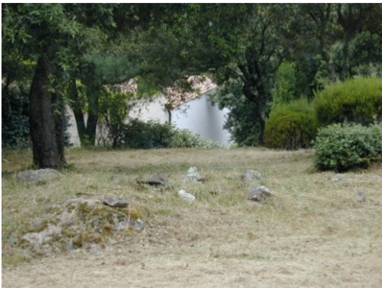
Photo 4 : propriété débroussaillée mais avec maintien des arbres à proximité immédiate de la maison. Le danger vient tout particulièrement du contact des branches avec la toiture.

Cela explique largement que toutes les obligations liées au débroussaillage ne sont dans l'immense majorité des cas que partiellement respectées. Ce non-respect prend deux formes principales : le maintien très fréquent d'arbres à faible distance de l'habitation d'une part (Photo 4) et le non-respect du périmètre réglementaire d'autre part. En effet, la zone débroussaillée n'atteint quasiment jamais le rayon de 50 ou 100 mètres imposé. C'est particulièrement vrai pour les habitations situées en périphérie des lotissements et donc en lisière de forêt.