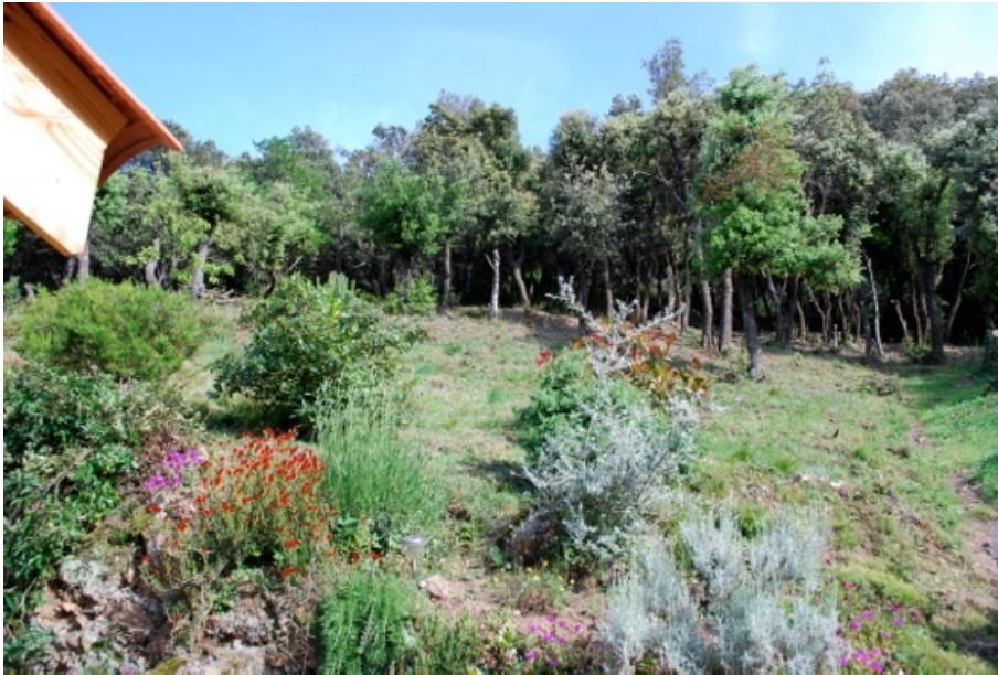
Photo 2 : périmètre débroussaillé et déboisé autour d'une habitation en bordure du Domaine des Albères.

Malgré les contrôles, on constate également que toutes les habitations sont loin de satisfaire aux normes ainsi édictées. Ceci est particulièrement vrai pour les résidences secondaires dont certaines ne sont absolument pas entretenues. Dans l'immense majorité des cas, on constate que le respect de l'obligation de débroussaillage n'est que partiel. Ce non-respect relève de deux catégories d'explication : l'incompréhension des normes et une résistance plus ou moins active à leur application. Le premier cas de figure est observé dans quelques jardins : il témoigne de l'incompréhension de certains termes techniques employés dans les brochures d'information du public, notamment par des propriétaires étrangers. Ainsi, dans deux cas observés, l'obligation d'élaguer les arbres à deux mètres de hauteur a-t-elle été mal comprise et les arbres étêtés, laissant dans le jardin des « poteaux » de deux mètres de haut (Photo 3). D'autres difficultés tiennent à l'interprétation et à la transposition des consignes théoriques sur le terrain pour savoir, par exemple, quels végétaux éliminer ou quels sujets peuvent être conservés.