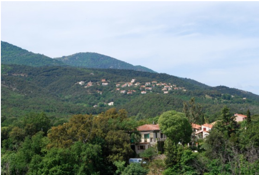
Photo 1 : Le lotissement « Domaine des Albères » vu depuis le centre du village de Laroque-des-Albères.

Ces résidents sont la plupart du temps aisés, même si cette aisance est parfois à nuancer dans la mesure où les lotissements ne sont pas totalement homogènes : les villas cossues possédées par de riches étrangers ou des cadres retraités coexistent en effet avec quelques pavillons plus modestes sur des parcelles plus petites, habités par des classes moyennes, souvent acquis avant l'explosion des prix immobiliers, ou reçus en héritage. Le phénomène, observé ailleurs dans le périurbain méditerranéen, contribue donc à « atténuer au plan statistique le contenu socialement très aisé de ces zones » (Pinson et Thomann, 2004, p. 6).