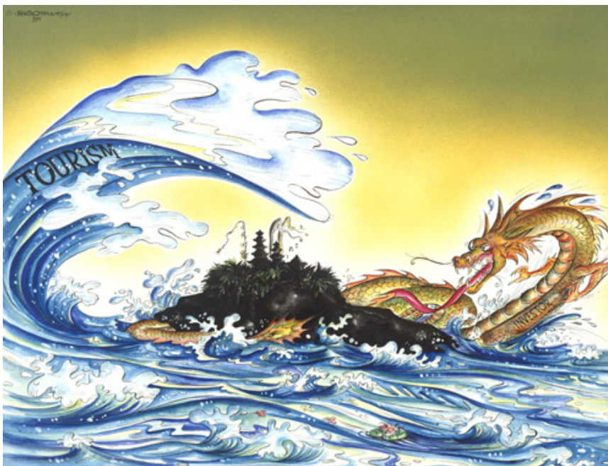
Illustration : Jango Pramatha, Naga et Bali, 1993. Photographie de Rio Helmi. © Michel Picard.

Il y a bien longtemps que je n'effectue plus de recherches sur le tourisme [1] . Le fait est qu'après avoir été partie prenante des travaux pionniers menés dans les années 1970, j'ai quitté ce domaine au moment où, dans les années 1990, il commençait à acquérir une certaine légitimité académique. Pour autant, je n'en avais pas terminé avec la question du tourisme, car les étiquettes ont la vie dure et je continue d'être sollicité au titre de mes travaux passés. L'exercice auquel je vais me livrer ici va consister à tirer les enseignements d'une réflexion entrecroisant mon itinéraire intellectuel, le développement du tourisme à Bali et l'évolution de l'attitude des Balinais confrontés à la touristification de leur île.