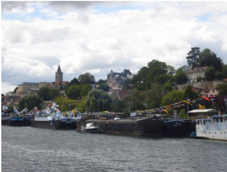
Photo 4 : Pardon de la batellerie à Conflans-Sainte-Honorine, C. PAUL, 2011.

de son territoire n'est donc pas partagée avec les « gens d'à terre ». C'est un trait majeur de cette urbanité.