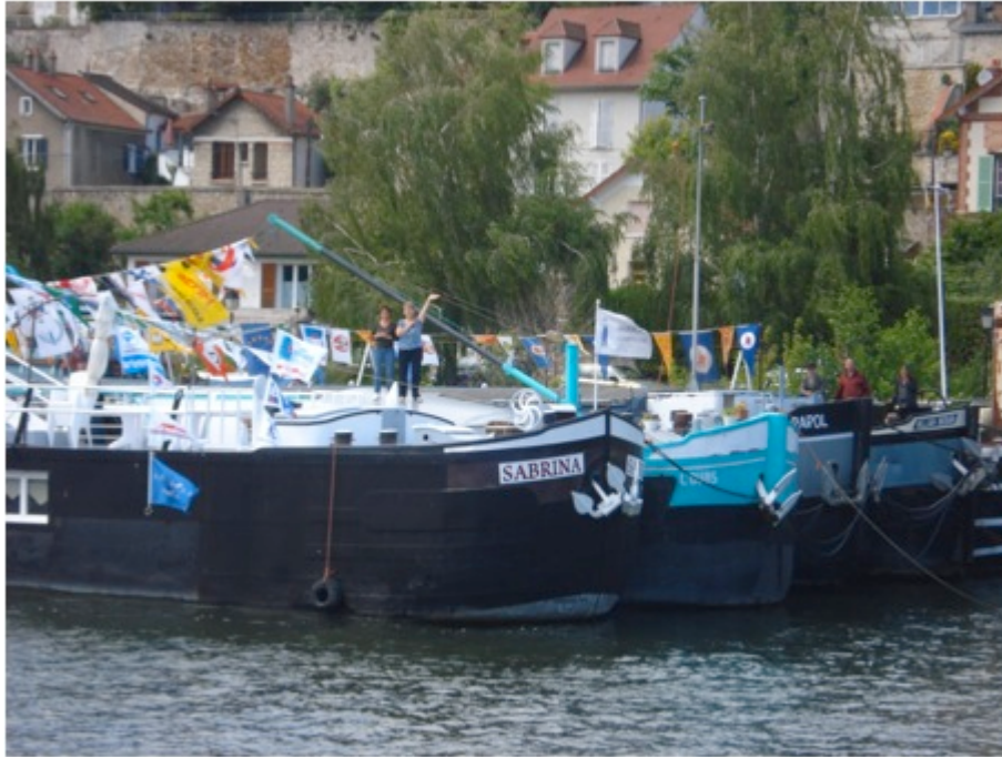
Photo 3 : Bateaux à quai à Conflans-Sainte-Honorine, C. PAUL, 2011.

trouvent aussi des services particuliers aux bateliers, tels que des associations familiales ainsi que des assurances spécifiques. Enfin, en raison de la volonté de se retrouver entre pairs, on observe en général qu'au moment de « la débarque », c'est-à-dire lorsque les bateliers cessent leur activité professionnelle, leur choix de résidence pour la retraite se porte sur des pavillons de ces villes en bordure de voie d'eau. Les bateliers ne disposant pas de capitaux suffisants pour devenir propriétaires d'une maison, finissent quant à eux leur vie à bord de leur bateau amarré dans ces mêmes villes.