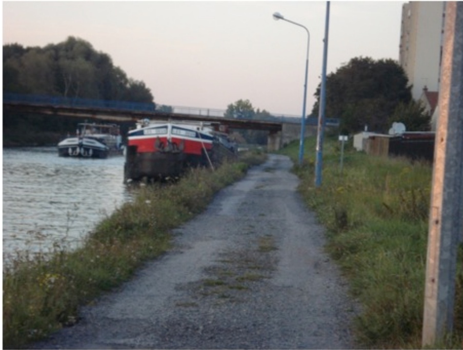
Photo 1 : Halte improvisée en aval de l'écluse de Noyon (Canal du Nord), C. PAUL, 2012

Toutefois, les mouvements répétitifs du batelier, par ses arrêts, aux mêmes « endroits-étapes », permettent peu à peu de créer une stabilité d'accueil et contribuent à créer des conditions d'implantation à certains endroits (Retailé, 2011). Il s'ensuit un timide développement de nouvelles infrastructures sur ces « lieux d'étapes » : points d'eau, électricité, système d'accès à Internet, pieux d'amarrage. L'espace mobile de la batellerie tendrait donc à se fixer un peu plus en certains lieux d'ancrage plus précis.