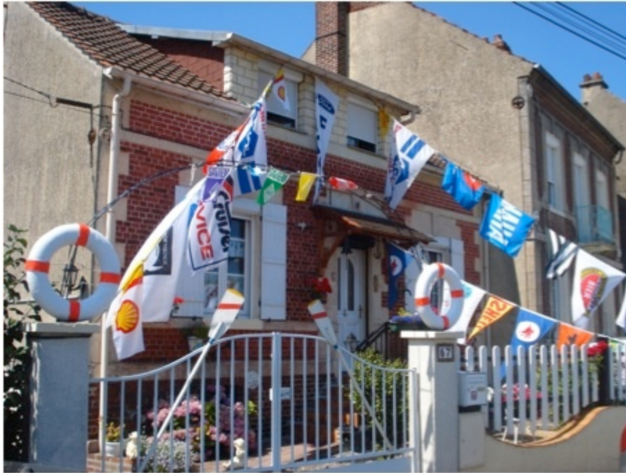
Photo 5 : Maison riveraine au canal latéral à l'Oise — Longueil-Annel (signes distinctifs : bouées, pavillons, ancre en haut à droite de la porte), C.PAUL, 2011.

Ainsi, il n'est pas rare de découvrir en guise de décoration une ancre marine placée dans le jardin ou le macaron [10] de la cabine de pilotage sur un des pans de la façade de la maison. Les bateliers ne fréquentent que les proches alentours de l'espace terrien (Manceron, 1996) mais on constate la présence de leur groupe par des marqueurs identitaires situés sur l'ensemble de la commune. En dehors des anciennes bourses d'affrètement près des quais, des bateaux-chapelles, des musées de la batellerie et des internats spécifiques aux enfants de bateliers, nombre de rues font référence à la profession telles que la rue du port de Berville, la rue du capitaine Ballot à Saint-Mammès. De même, le passage des bateliers est évoqué par le nom donné aux enseignes commerciales. À Conflans-Sainte-Honorine, on peut retrouver la « Pharmacie de la batellerie », « le Comptoir des mariners », etc. Il semble que les habitants non issus du milieu de la batellerie ont également le sentiment d'une identité spécifique de leur ville liée au fleuve. Les commerçants qui choisissent des noms de commerces faisant écho au milieu fluvial ou la municipalité qui relate régulièrement dans sa revue « Vivre à Conflans » son actualité en lien avec les activités du fleuve participent aussi au caractère batelier de la ville. Ces processus identitaires rendent ces villes humainement et socialement très significatives pour les bateliers (Dufour, 1987) en exercice ou à la retraite.