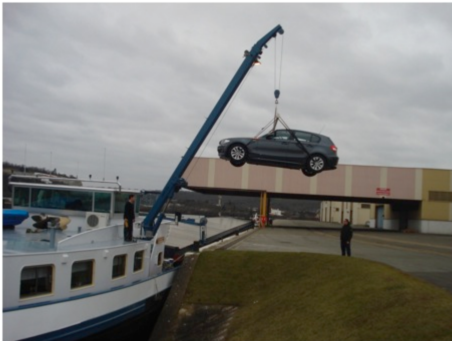
Photo 2 : Le débarquement de la voiture – port de Limay, C. PAUL, 2011.

n'a rien d'évident, pour des raisons à la fois pratiques, socio-économiques et culturelles. D'un point de vue pratique, à l'instar du « rural isolé » (Bigard et Durieux, 2010), le temps d'accès aux équipements dits urbains (services marchands et non marchands) peut-être très élevé pour cette population du fleuve. Nous avons développé combien les haltes portaient plus à l'isolement qu'à l'ouverture, et même lorsque celles-ci sont suffisamment aménagées et à proximité des centres urbains, l'accès à ces derniers peut être semé d'embûches. Après avoir amarré leur embarcation, il leur arrive couramment d'être confrontés à de nombreuses barrières physiques, telles que les clôtures et grilles de sécurité des différents chantiers et entreprises fluviales, nombreuses le long des berges (Paul, sous presse ). C'est une facette de la « grande déconnexion » entre le fleuve et la ville (Frémont, 2012). Par ailleurs, si les bateliers parviennent à débarquer leur voiture à terre en ces lieux, ils se trouvent souvent confrontés à des voies sans issue. Les différents obstacles auxquels ils doivent faire face illustrent bien le confinement de ce groupe professionnel dans des lieux en marge des espaces urbains mais parfois tout proches des grands centres urbains.