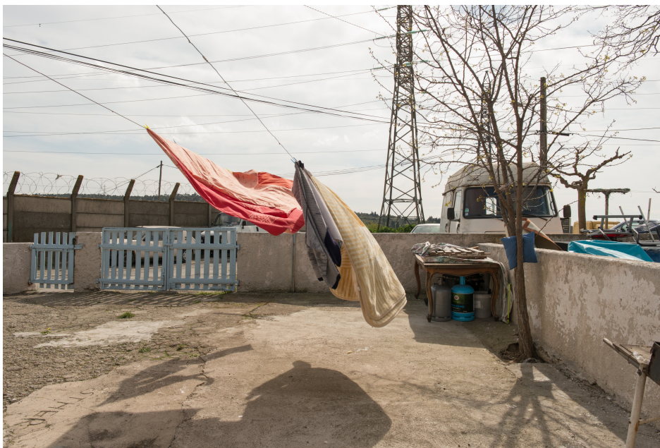
Image 1 : Hortense Soichet, « Les femmes gitanes de la cité de l'Espérance » (2016, p. 47).

Tout à fait là-bas, comme dans un ultime lointain, une colline. Entre elle et nous, des barbelés enroulés au sommet d'un mur ne ferment pas que l'horizon. Ils marquent sèchement les limites de la très controversée centrale électrique dont les fils, hirsutes de poteau en poteau, zèbrent le laiteux du ciel. Plus bas, un autre blanc. Cette fois, c'est le toit d'une camionnette. Il déborde des restes accumulés ici. Entre eux et nous, un autre mur, plus bas, et sa barrière, soigneusement peinte et fermée. Tout semblerait un peu figé si le linge, pendu au bout de sa corde, ne battait en plein vent. Même sans habitant-e-s visibles, la photographie ne trompe pas : toutes ces traces sont celles d'un lieu, d'un lieu habité. C'est ce que dévoilent, dans toutes leurs diversités mais chacune à sa manière, les presque 90 photographies réunies : deux lions qui ouvrent un seuil, un tigre qui rugit, des flamants un peu trop roses qui veillent patiemment, une cuisine bien ordonnée, une chambre bien colorisée, une pièce en fatras, des coussins avachis sur un lit, une table à la géométrie sans concession, une télévision en marche, etc. Est-ce donc que tout cela, la cité gitane de l'Espérance, à Berriac, près de Carcassonne, le long de l'Aude ?