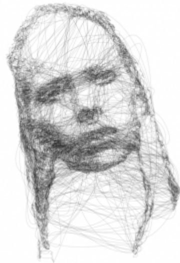
Figure 3 : Sigur Rós’ Kveikur (http://patakk.tumblr.com/). Source selon des actions et des mises en relation standardisées, plus ou moins omises. Il conserve alors ses richesses potentielles, sans réduire sa vitesse, mais seulement ses manières de s’étendre. L’acteur a été décrit dans cet article en tant qu’il s’engage dans l’espace urbain au travers d’épreuves d’ajout, de retranchement et de stabilisation pour soutenir les expériences qui le traversent selon ses actions. Il se définit par le style, la répétition, la

Loin des origines et des relations fixes, l’expérience qui se recompose sans cesse est à n dimensions. Elle est répétée et différenciée. L’expérience urbaine est certes rhizomatique, mais elle est un rhizome domestiqué par l’habitude et les reprises partielles d’actions déjà produites. Cette expérience constituerait un acteur rhizomatique 19 , qui n’est pas rigidifié par la copie, la répétition du même. Mais il est repris et ramassé selon des actions et des mises en relation standardisées, plus ou moins omises. Il conserve alors ses richesses potentielles, sans réduire sa vitesse, mais seulement ses manières de s’étendre. L’acteur a été décrit dans cet article en tant qu’il s’engage dans l’espace urbain au travers d’épreuves d’ajout, de retranchement et de stabilisation pour soutenir les expériences qui le traversent selon ses actions. Il se définit par le style, la répétition, la