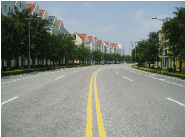
Abb. 4: Überbreite gebogene Straße im Zentrum der 'europäischen Stadt' Anting.

Die Südorientierung war bekannt und ist bei der Transposition des deutschen Stadtideals nach China reflektiert, jedoch in ihrer Bedeutung offenbar unterschätzt worden. Erst im Zuge der Realisierungsplanung hat sich die Brisanz dieses Aspektes den Akteuren mitgeteilt, was zu teilweise drastischen Anpassungen führte. Dabei dürfte das Shanghaier Bau- und Planungsrecht eine Rolle gespielt haben. In Befolgung ohnehin tief verwurzelter alltagskultureller Praktiken gestattet dieses keine Abweichung von der Südorientierung ohne Sondererlaubnis. Die Stadt war schließlich bereit, eine Abweichung für 30% des Wohnungsbestandes zu genehmigen. (Cai/Bo 2004, 74)