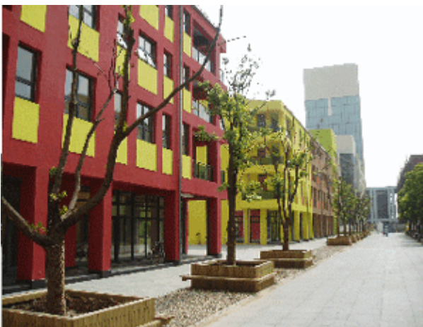
Abb.2: Dekorationslose Giebelfassaden an Wohngebäuden mit Gewerbeflächen im

Ein erster Blick sowohl auf die ursprünglichen Modelle, als auch auf die inzwischen im ersten (deutschen) Bauabschnitt realisierte Stadt zeigt diese Charakteristika mehr oder weniger deutlich: Es gibt einen zentralen Platz mit einer Kirche und größeren Gebäuden für öffentliche und kommerzielle Nutzungen, man findet Blockrandbebauung aus höhenorientierten Gebäuden mit Sattel- und Walmdächern, gekrümmte Straßen, Giebelfassaden und eine Umgrenzung durch eine Art von Stadtgraben. Auch die auffällige Farbigkeit - die Gebäude sind in Rot-, Gelb-, Ocker- und Blautönen angestrichen - zitiert die einstige Farbigkeit der europäischen Stadt.