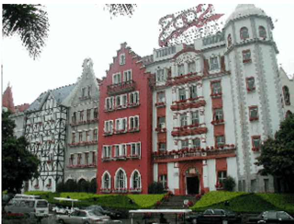
Abb.24: Europäische Stadtfiktion in Shenzhen.

Auf die besondere Situation, welche die fordistische bzw. funktionalistische Moderne für die urbane Mimikry mit sich brachte, wurde bereits wiederholt hingewiesen. (Hassenpflug 2000; Hassenpflug 2002) So hat der Funktionalismus in Architektur und Städtebau - in der Absicht, den gebauten Raum durch Zonierung und Beschleunigung effektiver zu gestalten - eine narrative Verarmung der Raumproduktion verursacht, welche für die fulminante Rückkehr der urbanen Fiktionen entscheidend wurde. Es konnte gezeigt werden, dass die Erlebnisindustrie den entstandenen Mangel an räumlichen Ästhetisierungen als erste identifiziert und in ein kommerziell zu befriedigendes Bedürfnis übersetzt hat. Die derart erkannte marktgängige Nachfrage nach Erlebniswelten befriedigte sie vorzugsweise durch Fiktionen der alteuropäischen Stadt mit ihren durch dekorierte Fassaden geschmückten öffentlichen Räumen. In China verbindet sich dieser kompensatorische Aspekt der Ästhetisierung mit einem unbändigen Interesse an Neuem, Fremdem, Exotischem, dass sich seit der Öffnung des allzu lange in sich gekehrten Landes Bahn brach.