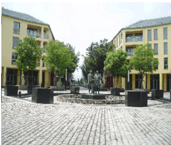
Abb. 10: Der Weimarplatz von Anting mit Kopie des Goethe- und Schiller-Denkmal.

In Anting wurde durchaus versucht, durch eine Vielzahl von kleineren, mal repräsentativen, mal pittoresken Plätzen dem Wunsch nach Introversion zu entsprechen. Viele der geometrisch durchgestalteten Plätze, z.B. der Weimarplatz mit der Kopie des Goethe- und Schillerdenkmals, der einzigen 'echten' Kopie in Anting, lassen sich jedoch nicht als introverse Räume interpretieren. Allzu entschieden denotieren sie europäische Extraversion.