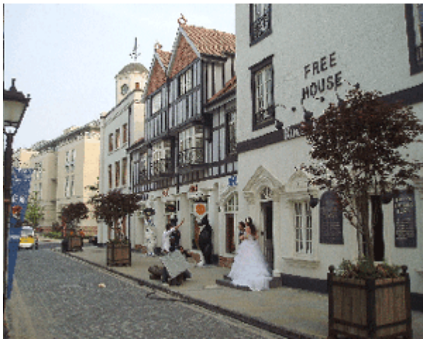
Abb.13: Straßenszene mit Hochzeitspaar in Taiwushi.

Thames Town lässt sich mit Anting Neustadt nicht vergleichen. Anting ist ein mit Idealismus randvoll gefülltes Projekt - und darin typisch deutsch. Es will authentisch sein, die Welt besser machen, Problemlösungen aufzeigen - und nebenher die überall bewunderte deutsche Ingenieurskunst demonstrieren.