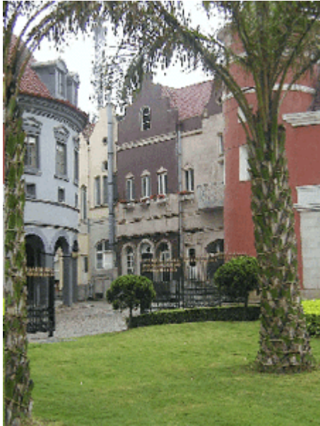
Abb.23: Europäische Stadtfiktion in Shenzhen.

Themenparks sind in China außergewöhnlich beliebt. Sie reflektieren eine Neugier an den Dingen, die man in ihrer Intensität eigentlich nur als radikale Negation einstiger Isolierung betrachten kann, eine Isolierung, welche weniger total war, als sie vielfach in diesem Lande dargestellt wird, die jedoch wie ein kollektives Trauma ausagiert wird. Isolationismus soll es nie mehr geben! Also wird alles, was die Welt an Schönerem, Sensationellem, Verwunderlichem, Märchenhaftem, Beeindruckendem, Unverwechselbarem etc. zu bieten hat, fotografiert, gescannt, abgemalt, nach China transponiert, eins-zu-eins oder en miniature nachgebaut und mit staunenden Augen besichtigt. In China soll es derzeit ca. 1000 Themenparks geben. (Sheng, Haitao 2007). Hauptstadt derselben ist ohne Zweifel die Boomstadt Shenzhen, wo bereits 1989 der erste Miniaturlandschaftspark unter dem Namen 'Prachtvolles China' eröffnet wurde. Der beispiellose Erfolg dieses Parks löste den Themenpark-Boom aus, welcher China zum Weltmeister der fiktionalen Welten gemacht hat.