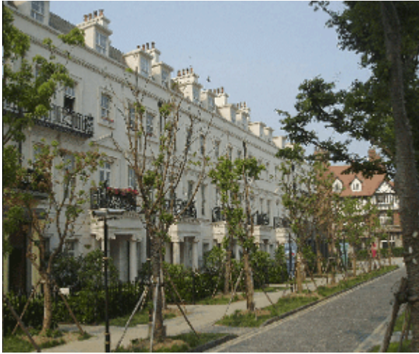
Abb. 14: Viktorianische Wohngebäude-Fiktion an einem 'Square' in Taiwushi, Shanghai.

Demgegenüber sind die Wohnquartiere, von wenigen Ausnahmen abgesehen, 'echt chinesisch'. Mit den Englandkopien im Zentrum von Taiwushi Neustadt haben sie - außer gelegentlicher Verwendung viktorianischer Stilelemente - faktisch nichts mehr zu tun. Es sind Villenquartiere, 'compounds' der gehobenen Mittelklasse, wie man sie heute überall in den Randbezirken chinesischer Großstädte findet.