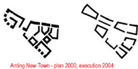
Fig. 2: Anting vorher - Anting nachher.

Blickt man auf die Modelle für den zweiten Bauabschnitt von Anting Neustadt, immerhin mehr als 50% der Gesamtfläche der Stadt, dann kann einem wegen der Vielzahl der nach Westen orientierten Wohngebäude schon Angst und Bange werden. Dieser Planungsstand mag auch der Grund dafür sein, dass bisher keine Freigabe für den Bau erteilt wurde. Gibt es noch Spielräume für eine verbesserte Süd-Orientierung? Wohl kaum, denn die aufwändige 'unsichtbare Stadt' (Infrastruktur) und das Netz der Straßen sind bereits fertiggestellt. Die dadurch vorgegebenen kompakten Baublöcke bieten zu wenig Raum für nach Süden orientierte (Blockrand)Zeilen. Einzige Lösung könnte eine Bespielung der Baufelder mit vertikalen Punktbauten sein. Dies würde jedoch den Charakter einer deutschen oder europäischen Stadt vollständig zerstören.