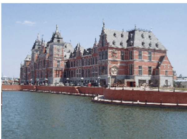
Abb. 20: Kopie des Hauptbahnhofs von Amsterdam in Shenyang.

Neu Amsterdam ist eine Stadt-Collage. Die Bilder wurden allerdings nicht aus den ganzen Niederlanden zusammengesucht und in einen Plan zusammengefügt, sondern man hat sich der reichhaltigen Ausstattung der berühmten holländischen Grachten-Metropole bedient. Ähnlich wie in Taiwushi und Luodian wurde ein Siedlungsbereich und ein kommerzieller Bereich unterschieden, doch sind die Grenzen hier weniger genau gezogen worden. Die städtebauliche Syntax von offen und geschlossen ist nicht deutlich erkennbar – und hierin gibt es, allerdings entfernte, Parallelen zu Anting.