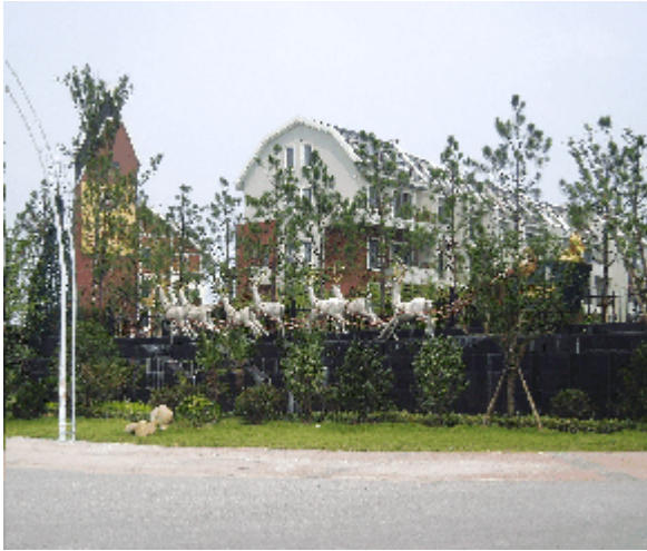
Abb.16: 'Branding' in Luodian durch Mansardgiebel-Dächer, Rentiere etc.

Um eine Kopie der schwedischen bzw. skandinavischen Stadt zu bewerkstelligen, ist man weder den deutschen, noch dem kopiertechnisch anspruchsvollen britischen Weg gegangen. Man hat sozusagen frei gestaltete, jedoch idealtypisch gemeinte nordische Häuser in Musterblöcken arrangiert. Die Produktion von Blöcken bereitete dabei überhaupt keine Probleme, da sowieso niemand in den Gebäuden des offenen Stadtbereichs jemals wohnen wird. Jeder Block ist an irgend einer passenden oder unpassenden Seite aufgebrochen. Durch ein symbolisches hölzernes Tor kann man den Innenhof betreten - und steht dann auf einer versiegelten Fläche in die meist runde oder ovale Grünflächen eingelassen sind.