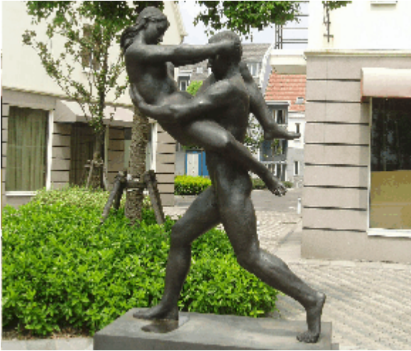
Abb.17: Nacktheit als Markenidentität von Luodian, Shanghai.

Als weiteres Merkmal des Nordischen hat man schließlich noch das hölzerne Tor an den Plätzen ausgegeben. Moment! Hölzerne Tore an schwedischen Stadtplätzen? Handelt es sich dabei um ein Wiedererkennungs-Merkmal der skandinavischen Stadt? Mir scheint dies etwas weit hergeholt, um nicht zu sagen: abwegig. Bleibt als Erklärung nur der Versuch, durch die Tore einen in China als willkommen unterstellten Verriegelungseffekt zu erzielen. Da es eine Fülle von Blocks gibt, gibt es entsprechend viele Plätze und da die Plätze manchmal mehr als einen Eingang/Ausgang besitzen, zudem für viele Platzzugänge zwei Tore - straßenseitig und platzseitig - vorgesehen sind, entsteht in einigen Bereichen eine geradezu groteske Verriegelungsdichte.