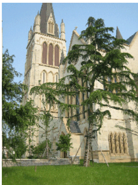
Abb.15: Kopie einer Kathedrale in Taiwushi.

abgesehen, nicht. Sie sind schließlich introvertiert, d.h. mit Nachbarschaftshöfen bzw. introversen Parkanlagen ausgestattet. An Großbritannien erinnern in diesen Bereichen außer der Bekleidung des Wachpersonals nur noch die Ausstattung der offenen Erschließungsstraßen mit den bekannten roten Giles G. Scott-Telefonzellen, ebenfalls roten Postboxen, Feuermeldern etc.