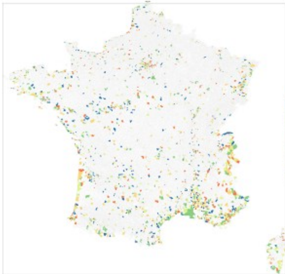
Carte 5 : Les relations entre services touristiques. Carte des communes françaises colorées en fonction du ratio nombre de commentaires d'attraction/nombre de commentaires d'hôtel. Les communes avec moins de dix avis sur les hôtels et dix avis sur les attractions ne sont pas représentées.

L'usage des données issues de TripAdvisor permet également de caractériser les territoires, à différentes échelles. En effet, pour chaque commune sont commentés trois types de lieux : les attractions touristiques (sites, musées, tours privés, etc.), les hôtels et autres hébergements, les restaurants. Chaque territoire peut donc être défini comme une relation particulière entre ces trois catégories de services touristiques, relation qui dépend à la fois d'une répartition objective (nombre de restaurants, hôtels, musées) et de l'importance relative donnée à chacune des activités, dans l'expérience touristique, comme dans la volonté d'en rendre compte. Il est également possible d'identifier les connexions réalisées par chacun des internautes et de les modéliser. La Carte 5 propose une France des relations entre services touristiques, basée sur le nombre de commentaires par commune, entre l'ensemble des attractions et les hôtels. Cette carte est ainsi celle des hauts lieux touristiques et des communes touristiques dortoirs, bref de la polarisation centre-périphérie de l'espace touristique. En creux, se lisent plusieurs types de relations entre espaces au sein d'une même destination régionale ou locale : entre des espaces de la convoitise et des espaces de la relégation touristique, par exemple.