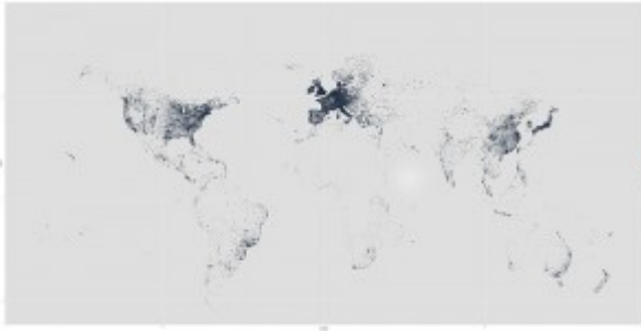
Carte 1 : Le monde selon TripAdvisor. Carte des sites référencés par TripAdvisor en avril 2014 ; seuls les sites contenant des coordonnées GPS sont dessinés.