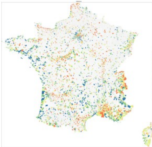
Carte 3 : Les communes au prisme de l'origine des commentateurs. Carte des communes françaises colorées en fonction du pourcentage de commentaires postés par des Français (Tripadvisor). Les classes sont issues du calcul des quartiles. Les communes avec moins de dix avis contenant l'origine ne sont pas représentées.